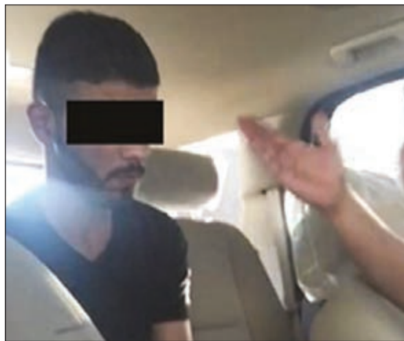
الخليجي خلال القطع الذي استغرق «الداخلية»