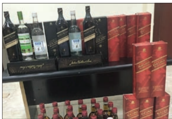
زجاجات الخمر معدة للتوزيع