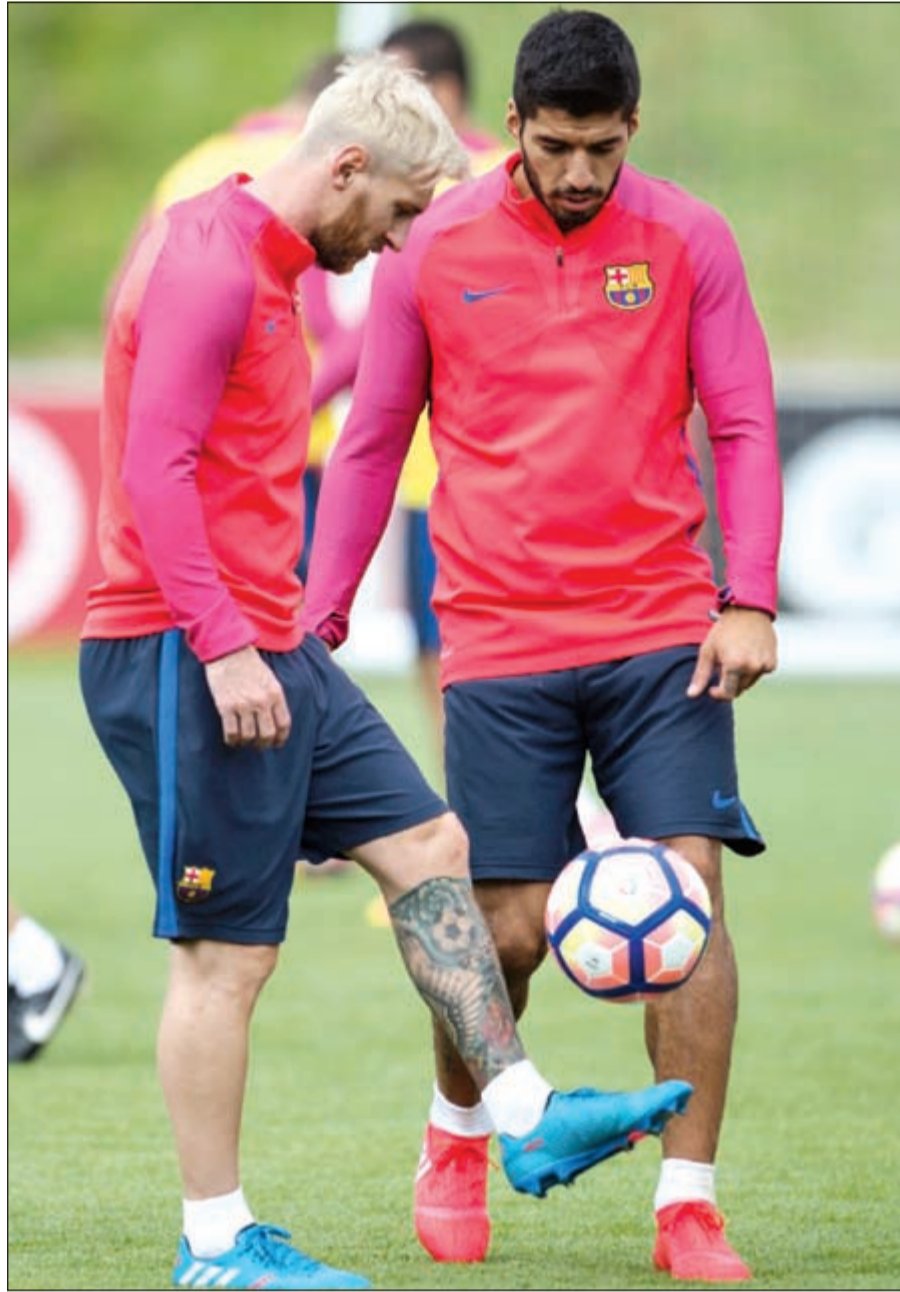
ميسي وسواريز أثناء التدريبات

وسجل قلب دفاع أتلتيكو مدريد، الأوروغوياني دييغو غودين هدف المباراة الوحيد في الدقيقة 40 من عمر اللقاء.