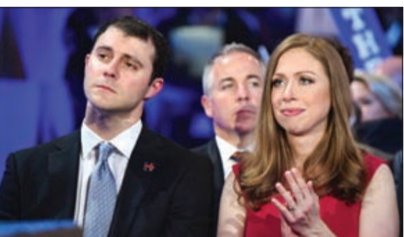
تشيلسي كلينتون تحتفل بترشيح والدتها برفقة زوجها مارك ميزفينسكي

تشيلسي كلينتون: والدتي تقدمية ستحارب من أجل قضايا العصر الحديث