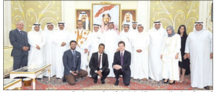
الشيخ د. أحمد ناصر الحمد متوسطا إسماعيل ولد الشيخ أحمد وعددا من الحضور

اليمن إسماعيل ولد الشيخ أحمد وسفير خادم الحرمين الشريفين لدى الجمهورية اليمنية محمد آل جابر. حضر المأدبة مساعد وزير الخارجية لشؤون مجلس التعاون لدول الخليج العربية السفير ناصر المزين والسفير سالم الزمانان وسفيرنا لدى اليمن فهد اللميع ومساعد وزير الخارجية لشؤون الوطن العربي السفير عزيز الدحاني ونائب مساعد وزير الخارجية لشؤون مكتب النائب الأول لرئيس مجلس الوزراء ووزير الخارجية السفير الشيخ د. أحمد ناصر الحمد أمس مأدبة غداء على شرف مبعوث الأمين العام للأمم المتحدة إلى