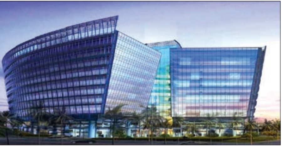
المبنى الجديد لوزارة التربية

سيارة شامل الموظفين وبعض المراجعين بكفي في المبنى الجديد، مشيرة إلى أن بقية المراجعين ستكون سياراتهم خارج الوزارة. وذكرت إلى أنه رغم إلغاء دور من مواقف السيارات غير أن ذلك سيكون حلا جزئيا لمشكلة العدد الكبير لإدارات الوزارة في قطاعاتها المختلفة، مشيرة إلى أن الأمر وارد لإبقاء أحد القطاعات في المبنى الحالي لعدم قدرة المبنى الجديد على استيعاب جميع موظفي الوزارة. يذكر أن المبنى الجديد للتربية تم العمل بإنشائه منذ عدة سنوات وتأجل تسلمه أكثر من مرة ولازال التأجيل مستمرا.