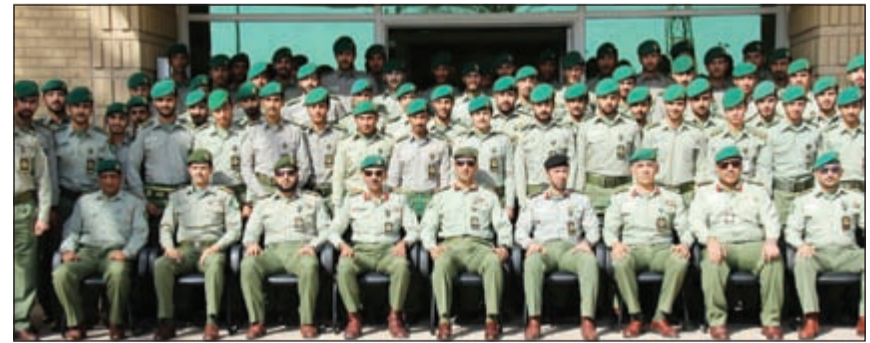
المشاركين في دورة الضباط حديثي التخرج

التخرج إلى ضرورة الالتزام بالأوامر والتعليمات العسكرية إضافة إلى الضبط والربط العسكري والتخلي بروح الجد والمخاضرة والتميز في التدريبات، مؤكدا أن هذه الدورات تخرج سنويا أجيالا مؤهلة تشارك بعقولها وسواعدها في حماية الوطن وصيانة أمنه واستقراره. وفي ختام الحفل قام العميد الركن بدر عبدالله حمد بتوزيع الجوائز وشهادات التقدير على الخريجين. حضر الحفل عدد من كبار الضباط في الحرس الوطني.