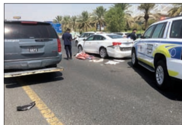
المركبة التي تعطلت وتسببت في مصرع قائدها

نتيجة انحراف مركبة كانا على متنهما واصطدامها بشجرة وانسداد الخيران بها. وتم اسعاف المصابين في حالة حرجة إلى غرفة الإنعاش بمستشفى العدان من موقع الحادث على طريق الملك فهد.