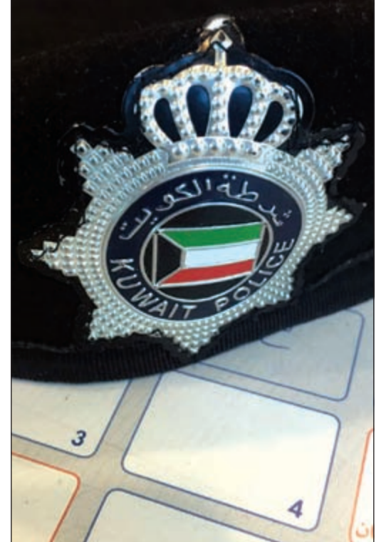
شكل البريه بجلته الجديدة بتوسطها علم الكويت

تعميم أممي بشأن شكل شعار «البريه» لعموم قوة الشرطة