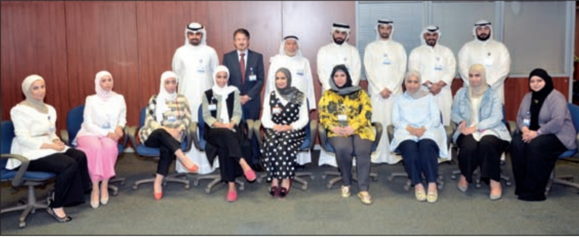
الموظفون المشاركون في الدورة

عالية أهلت المتدربين لمنحهم شهادة اجتياز الدورة بنجاح. وصرح د.عبدالحى بأن نجاح عقد هذه الدورة يقع ضمن سلسلة من البرامج المتكاملة يتم تنفيذها على مراحل وفق خطة منهجية وذلك انطلاقا من سياسة «الدولي» بأن التدريب عملية مستمرة من شأنها البلوغ بموظفيه إلى احترافية مهنية متميزة تؤهلهم لمواكبة التطور المضطرب في الصناعة المصرفية الإسلامية، المصاحب للإقبال المتنامي على الخدمات المصرفية الإسلامية.