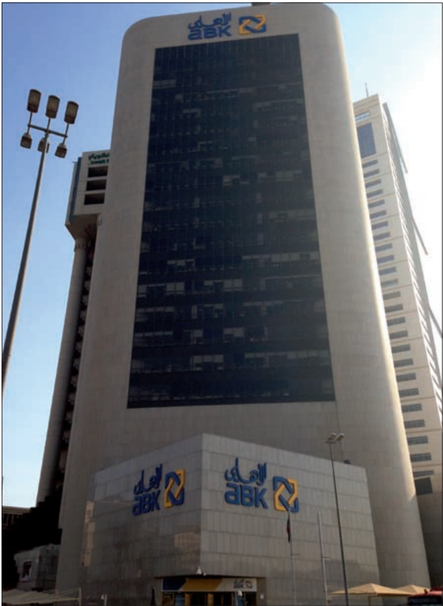
مبنى البنك الأهلي الكويتي

خطوات واثقة لتدعيم البنك في مواجهة الأوضاع الاقتصادية الحالية، وينصب تركيزنا حالياً على ضمان تلبية احتياجات العملاء من خلال المزيد من تطوير الخدمات الإلكترونية، والتي من شأنها تأمين وتيسير العمليات المصرفية التي يقدمها البنك. وعلاوة على ذلك، فإننا نقوم بتطوير البنوك التابعة لمجموعتنا في الكويت والإمارات ومصر، كما حصلنا مؤخراً على موافقة الجهات الرسمية المصرية لتغيير العلامة التجارية وستبدأ بتغييرها على مستوى 39 فرعاً.