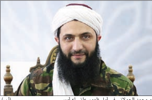
أبو محمد الجولاني في اول ظهور علني له أمس

عواصم - وكالات: أعلن أبو محمد الجولاني فك ارتباط «جبهة النصرة» التي يزعمها عن تنظيم «القاعدة» وتغيير اسم الجبهة إلى «جبهة فتح الشام». وأكد الجولاني في ظهوره العلني الأول أن جبهة «فتح الشام» ليست لها أي علاقة بأي تنظيم خارجي. وأشار إلى أن هذه الخطوة تأتي «مستحبا للذرائع من المجتمع الدولي وخاصة الولايات المتحدة وروسيا في قصفهم وتشريدهم السوريين بحجة استهدافهم لجبهة النصرة التابعة للقاعدة».