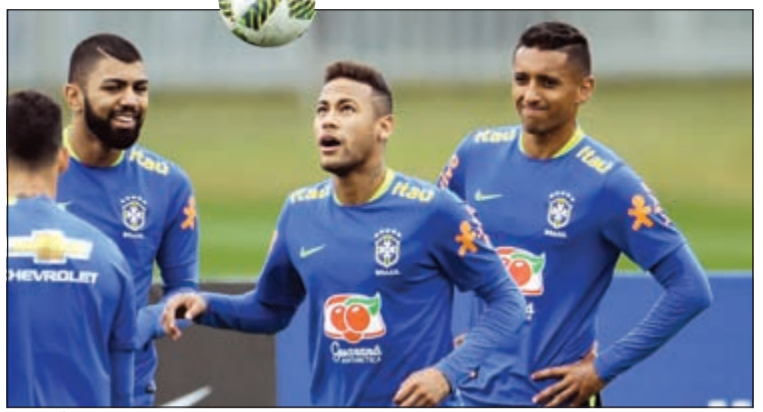
النجم نيمار يدافع الكرة خلال تدريبات المنتخب الأولمبي البرازيلي

الاوروغواي 2-2 في تصفيات مونديال 2018 عندما نال بطاقة صفراء. توجه نيمار مباشرة إلى الصحفي: «لو كنت أنت بعمر الرابعة والعشرين، ألم تكن لتفعل الشيء نفسه؟ أنا أسألك». وفاجأ مدرب البرازيلي روجيريو ميكالي البعض الأسبوع الماضي عندما قال: «أريد أن أكون مقتنفاً على نيمار». في اليوم التالي، حذر تيتي، الذي سيستلم تدريب المنتخب الأول بعد الأولمبياد، من وضع ضغط كبير على نيمار، معتبراً أنه من «غير الإنساني تحميل المسؤولية لشخص واحد». ولم تحرز البرازيل، بطلة العالم 5 مرات ذهبية الأولمبياد أي مرة في تاريخها، وتلعب البرازيل مباراة ودية مع اليابان السبت في غويانيا. وتخوض منافسات المجموعة الأولى ضمن الأولمبياد ضد جنوب أفريقيا، الدنمرك والعراق.