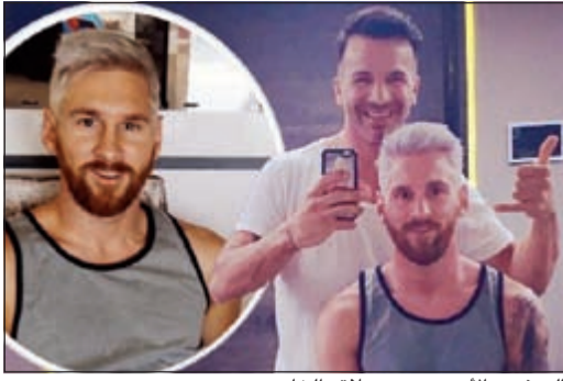
البرغوث الأرجنتيني وحلاقه الخاص

كشفت أرييل برمودز، الحلاق الخاص للنجم الأرجنتيني ليونيل ميسي مهاجم برشلونة الإسباني في تغريدة له على حسابه الخاص في موقع التواصل الاجتماعي «انستغرام»، أنه هو الذي أقمع ميسي بالظهور بالشكل الجديد الذي ظهر به في وسائل الإعلام عقب عودته من إجازته الصيفية. وكان ميسي قد ظهر بـ «لوك جديد» يختلف تماما عن اللوك الذي كان عليه في المواسم الماضية، حيث أطلق لحيته بشكل بارز فضلا عن تغييره لتسريحة ولون شعره.