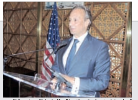
السفير الشيخ سالم العبدالله يلقي كلمته خلال مراسم التكريم

«أم أبو تراب» نفت علاقتها بتنظيم «داعش» الإرهابي فاطقت المحكمة سراحها بلا ضمان 14