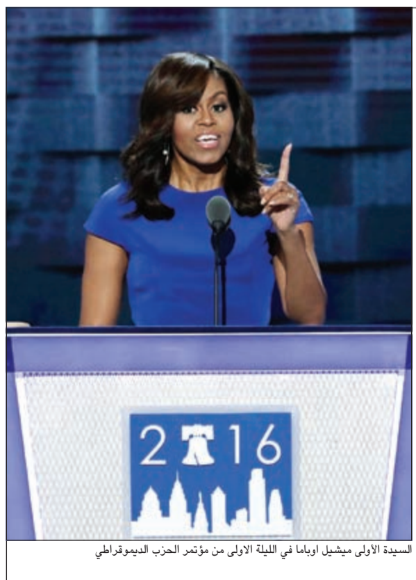
السيدة الأولى ميشيل أوباما في الليلة الأولى من مؤتمر الحزب الديمقراطي

المعلومات الأولية تؤكد أن مريضاً قتل طبيباً قبل أن يقتل نفسه. أما اليابان التي تعتبر من أقل الدول في معدلات الجريمة،