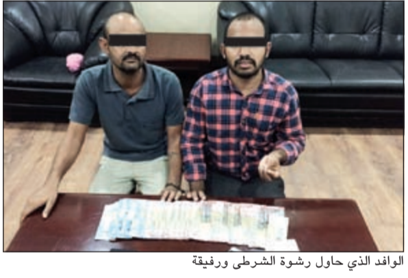
الوافد الذي حاول رشوة الشرطي ورقيفة

لمباحث شؤون الإقامة أبلغ عن تلقيه عرضاً من وأفد هندي الجنسية يقضي بمنحه مبلغ مالي قدره 1100 دينار كويتي مقابل تسهيل خروج أحد المحتجزين فيها والذي كان مقرراً إبعاده عن البلاد لمخالفته قانون الإقامة. وبعد اتخاذ الإجراءات القانونية المناسبة تم ضبط هذا الوافد المناسب بحقه تهمة رشوة موظف عام وأحيل إلى الجهات المختصة للتعامل معه.