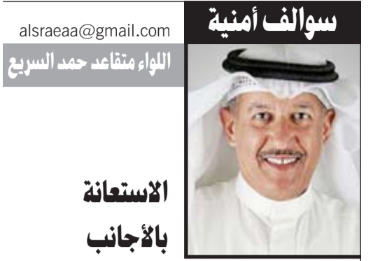
السوالف أمنية السوالف الأمنية السوالف الأمنية