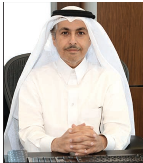
الشيخ سعود بن ناصر آل ثاني

زيادة حصتها السوقية من الإيرادات. وواصلت جهودها التسويقية النشطة لخدمات البيانات معتمدة في ذلك على الجودة العالية لشبكتها، مما أدى إلى جذب المزيد من العملاء وتحقيق زيادة في حصتها في سوق البيانات من الجيل الثالث. وقد أطلقت خلال الشهر الحالي خدمات الجيل الرابع بعد حصولها على الترخيص. واستطاعت Ooredoo تونس، التي تعمل في ظروف اقتصادية وسياسية لا تخلو من التحديات، تحقيق نتائج جيدة على الرغم من الأثر السلبي لانخفاض سعر العملة التونسية وتأثيره على البيانات المالية العامة المعلن. الأمر الذي مكنتها من البقاء في المرتبة الأولى، حيث بلغ عدد عملائها 7,6 ملايين عميل على الرغم من استحداث إمكانية نقل رقم الهاتف من شركة اتصالات إلى شركة اتصالات أخرى في شهر أبريل. وقد استثمرت في استراتيجية البيانات وأطلقت