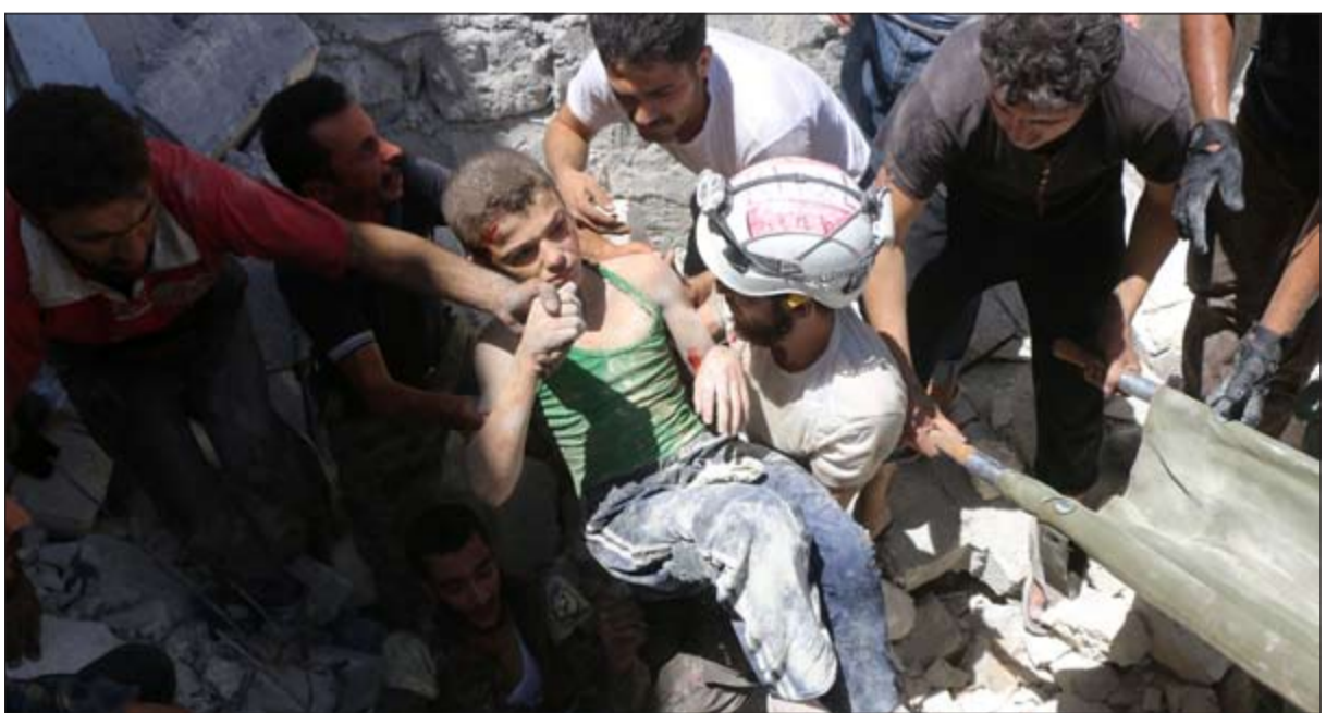
رجال الدفاع المدني(القبعات البيضاء) ينتشلون طفلاً من تحت انقاض منزله في حي المشهد بحلب

عواصم - وكالات: أعلنت المتحدثة باسم موقد الامم المتحدة الخاص الى سورية ستافان ديمستورا، انه الاخير سيلتقي اليوم في جنيف ممثلين كبيرين عن روسيا والولايات المتحدة في محاولة لتحريك محادثات السلام السورية. وقالت المتحدثة جيسبي شاهين لوكالة فرانس برس ان «اللقاء سيحدث في جنيف» وسيلتقي ديمستورا الموقد الأميركي لسورية مايكل راتني، ونائب وزير الخارجية الروسي غينادي غاتيلوف. وقال غاتيلوف تعليقا على الاجتماع الثلاثي حول سورية قائلاً: «إن موسكو تنظر بشكل بناء إلى اللقاء المرتقب وتوقع تبني واشنطن في المقابل موقفاً العملية السورية» بحسب ما نقلت عنه «روسيا اليوم». في هذه الأثناء، انتقدت المعارضة السورية إعلان النظام السوري استعداده لاستئناف محادثات السلام في وقت يواصل حرق القرار 2268 الذي أقر وقف العمليات القتالية، وذلك باستهداف النظام لستة مستشفيات في حلب، وكذلك أحد المستشفيات في آثارب، ودمرها بشكل كامل، بحسب أكد منظر ماخوس، المتحدث باسم الهيئة العليا للمفاوضات السورية. وعلى الصعيد الدولي، شدد وزير الخارجية جون كيري لنظيره الروسي، سيرغي لافروف، على أهمية العودة لطاولة المفاوضات مع مؤشرات على قرب توصل الطرفين إلى تفاهم يحدد مصدر من المعارضة السورية لصحيفة الشرق الأوسط. ونقلت الصحيفة عن المصدر المطلع على جزء من التفاهم