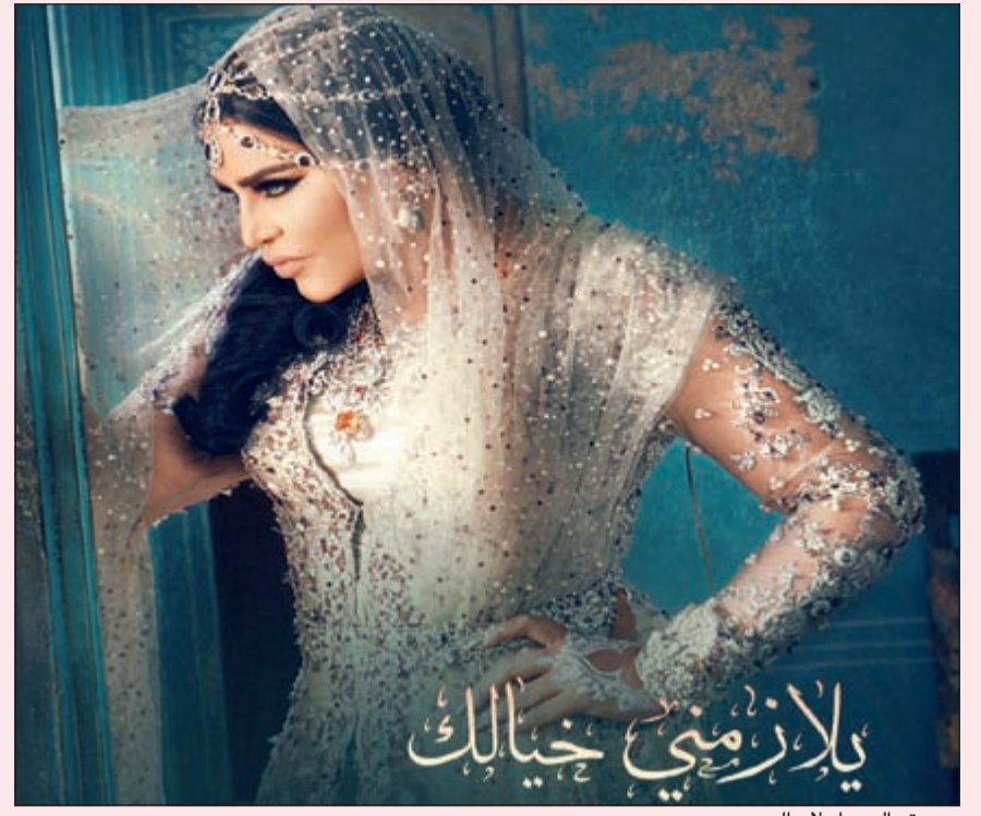
يوستر اليوم أحلام الجديد

تدشن الفنانة الإماراتية الكبيرة أحلام ألبومها الجديد «يلازمني خيالك»، من على خشبة المسرح الملكي بـ «معهد الموسيقى العربية» بالقاهرة، غداً «الثلاثاء». وفي هذا الصدد أكدت أحلام جاهزيتها وفريق العمل المساعد، على إخراج الحفل بالشكل الذي يتناغم مع عبق التاريخ وعظمة المكان الذي ساهم في الارتقاء بالذوق الفني العربي، مؤكدة أنها ستستدير على خطى «فريق الأحلام» من العظيما اللاتي غنّين على خشبة هذا المسرح التاريخي، أمثال: «كوكب الشرق» أم كلثوم و«سفيرة النجوم» فيروز، وغيرهن. هذا، وتقدم الحفل، الذي سيبدأ في تمام الساعة التاسعة والنصف بمعهد الموسيقى