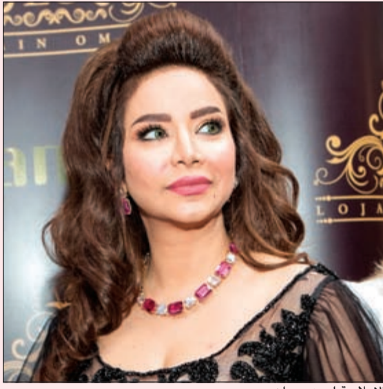
الإعلامية لجين عمران

العربية بـ «رمسيس»، الإعلامية السعودية لجين عمران. ومن المتوقع أن يحضره نخبة من أهل الفن والسياسية والثقافة والإعلام في مصر والعالم العربي. وتقدم أحلام في حفلها الكبير معظم أعمال ألبومها الجديد، الذي يتكون من عشرة أغنيات، على رأسها مفاجاتها الجديدة «يلازمني خيالك»، وهي من كلمات الشاعرة السعودية المشهورة «وشم» والحنان الموسيقار المعروف ناصر الصالح. وأكدت أحلام أنها اختارت القاهرة تحديداً لتدشين ألبومها الجديد، وفاء لدور مصر التاريخي بكل الأصدقاء، وتقديراً منها لـ «سيد سلف» وسدا لـ «دين مستحق» - على حد تعبيرها. هذه هي أخلاقيات تليق من توجهت بلقب «فتاة العرب».. تستاهلين يا أم فاهد.