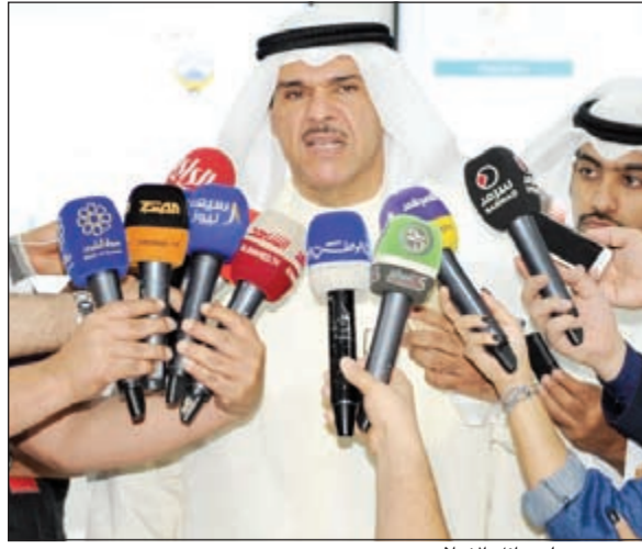
... ويتحدث لوسائل الاعلام