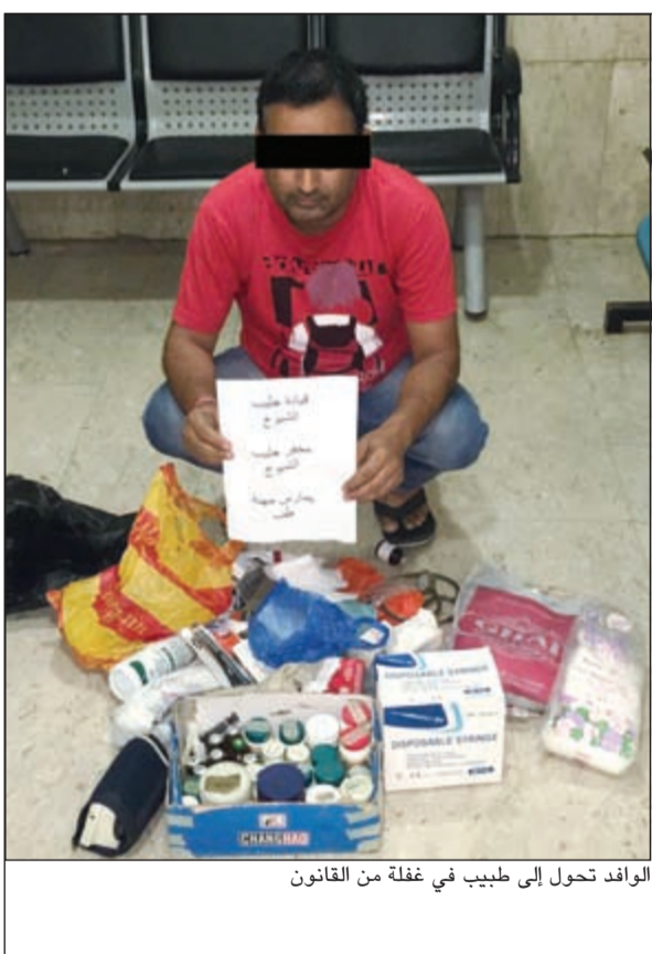
الوافد تحول إلى طبيب في غفلة من القانون