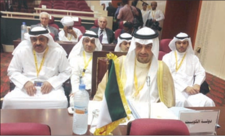
أنس الصالح خلال مشاركته في الاجتماع التحضيري للمجلس الاقتصادي والاجتماعي

نواكشوط - (كونا): أكد نائب رئيس مجلس الوزراء وزير المالية ووزير النفط بالوكالة أنس الصالح قيام الكويت بجميع الجهود اللازمة لتنفيذ قرارات القمة العربية الدورية والاقتصادية من أجل الارتقاء بالمواطن العربي.