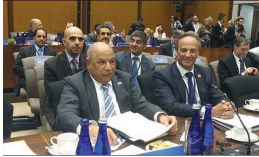
الشيخ خالد الجراح خلال مشاركته في الاجتماع بحضور السفير الشيخ سالم العبدالله

واشنطن - كونا: قال نائب رئيس مجلس الوزراء وزير الدفاع الشيخ خالد الجراح ان موقف الكويت كان ولا يزال وسيبقى ثابتاً ازاء دعم جميع الجهود الدولية والاجراءات المتخذة للقضاء على التنظيمات الارهابية.