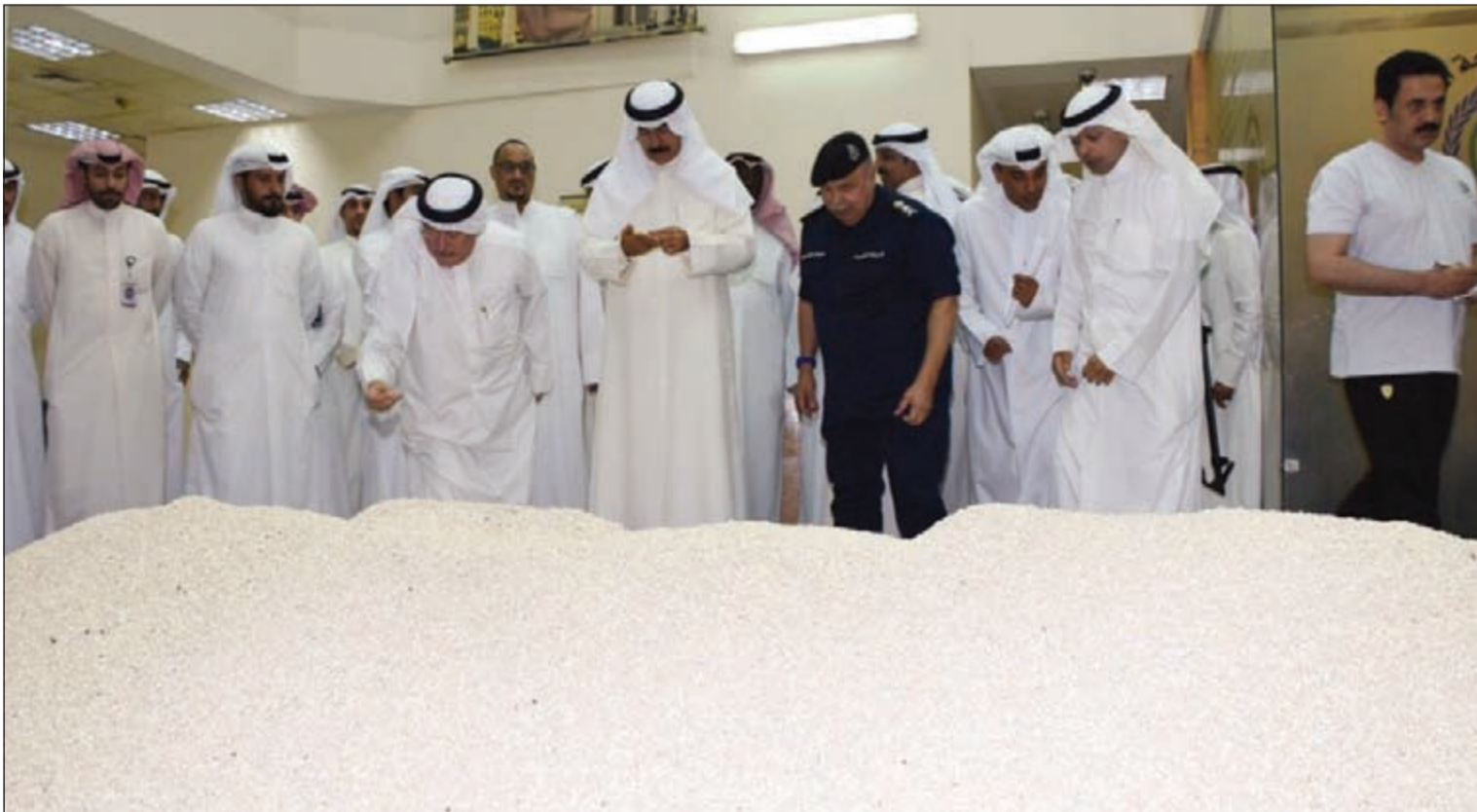
الشيخ محمد الخالد خلال معاينة كميات «الكبتى» المضبوطة ويبدو الفريق سليمان الفهد ورجال الإدارة العامة لمكافحة المخدرات

الخالد: نقف بالمرصاد لكل من تسول له نفسه العبث بأمن الكويت