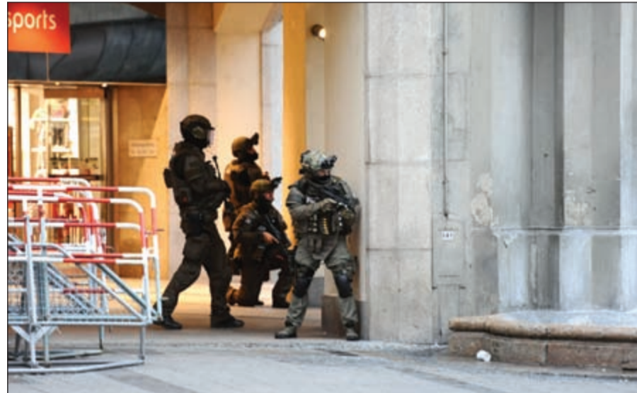
القوات الخاصة الألمانية قبيل اقتحامها المركز التجاري في ميونيخ لإجلاء رواده

«إن.تي.في» التلفزيونية الألمانية أن القوات الخاصة التابعة للشرطة الألمانية وصلت لموقع المركز التجاري حيث أجلت رواده. وفي وقت لاحق، أطلقت شرطة ميونيخ عملية أمنية كبيرة في المدينة. وناشدت الشرطة الجميع عدم التواجد في الأماكن العامة، وعلقت وسائل النقل العام ومترو الأنفاق والقطارات عقب الهجوم، بما في ذلك محطة القطار الرئيسية في ميونيخ، وذلك تحسباً لأي هجمات إرهابية محتملة. وقال وزير العدل الألماني هيكو ماس لصحيفة بيلد الألمانية: «ليس هناك سبب للذعر لكن من الواضح أن ألمانيا لاتزال هدفاً محتملاً». وفي غضون ذلك، أهابت وزارة الخارجية الكويتية بجميع المواطنين المتواجدين في مدينة ميونيخ الألمانية توخي الحذر والابتعاد عن أماكن التجمعات والتجاوب مع تعليمات السلطات الأمنية.