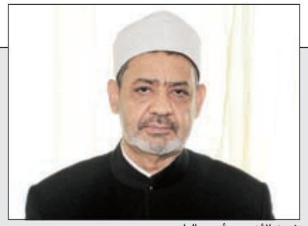
شيخ الأزهر د.أحمد الطيب

شيخ الأزهر لـ «الأنباء»: أدعو علماء السنة والشعبة لإصدار فتاوى تحرم الاقتتال بين أتباع المذهبين وإيقاف شلالات الدم