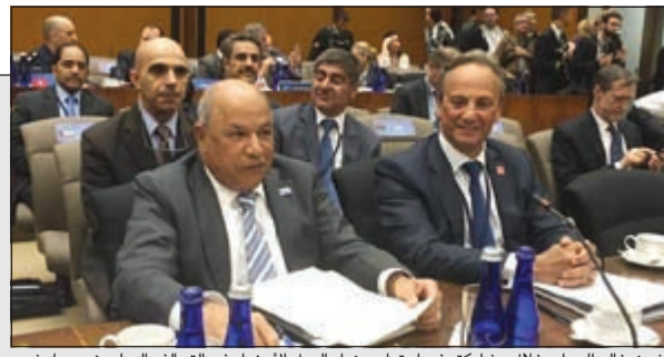
الشيخ خالد الجراح خلال مشاركته في إجتماع وزراء الدول الأعضاء في التحالف الدولي ضد داعش.