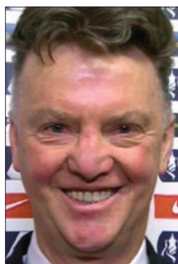
فان غال.. هل يضحك مستقبلاً؟

تعرض البرتغالي جوزيه مورينيو مدرب مان يونايتد لخسارة الأولى رفقة النادي الإنجليزي الكبير مان يونايتد أمام بوروسيا دورتموند الألماني وبتحفة ثقيلة (4 - 1) ضمن منافسات الكأس الدولية للأبطال لكرة القدم المقامة في الصين. وكان «سبيشال ون» قد نجح في الفوز بأول مباراة له مع فريقه الجديد أمام ويغان الإنجليزي 2 - 0. وشكك جمهور عريض من محبي الـ «مان» في قدرة مورينيو على إعادة اللحمة إلى الفريق الذي يغيب عن البطولات خلال المواسم الماضية وذلك بالنظر إلى البداية المتواضعة لأداء الفريق، وهو ما يعزز الانطباع بأن إدارة الـ «مان» ربما تسرعت في إقالة فان غال المدرب الهولندي الذي ربما يضحك الآن. وتنتظر مورينيو مواجهة قوية بعد غد الاثنين أمام غريمه بيد غوارديولا مدرب مان سيتي في البطولة نفسها.