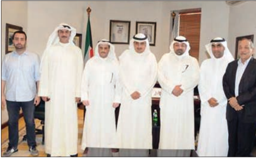
م.أحمد المنفوحى خلال استقباله الشيخ يوسف العبدالله

استقبل مدير عام بلدية الكويت م.أحمد المنفوحى، صباح أمس، في مكتبه مدير عام مؤسسة الموانئ الشيخ يوسف العبدالله، حيث عقد اجتماعاً مشتركاً بحث خلاله عدداً من المواضيع في إطار تسهيل إجراءات الجهات الحكومية بالدولة. وقال الشيخ يوسف العبدالله: اجتمعنا مع مدير عام البلدية لإطلاعنا على احتياجات «الموانئ»، حيث ناقشنا كل المواضيع التي تهم المؤسسة ومنها تحويل الأراضي التخزينية إلى منطقة لوجستية حتى نحقق المعايير الدولية التي وضعها البنك الدولي لتكون مدينة الكويت من أفضل المدن في هذا الجانب. وأشار إلى أن المنفوحى كان مرحباً ومتفهماً لجميع النقاط التي تم بحثها بالاجتماع وسيكون هناك تعاون كبير بين مؤسسة الموانئ الكويتية وبلدية الكويت لتكون «الموانئ» بوابة المركز المالي والتجاري للكويت من خلال تطوير مرافقها. وأوضح الصباح أن مؤسسة الموانئ في حاجة إلى تطوير مرافقها والمرافق المساندة، فنحن اليوم من أسوأ الموانئ في منطقة الخليج من حيث المعيار اللوجستي، مشدداً على أن المؤسسة مؤتمنة على تلبية رغبة صاحب السمو الأمير بأن تكون الكويت مركزاً مالياً وتجاريًا.