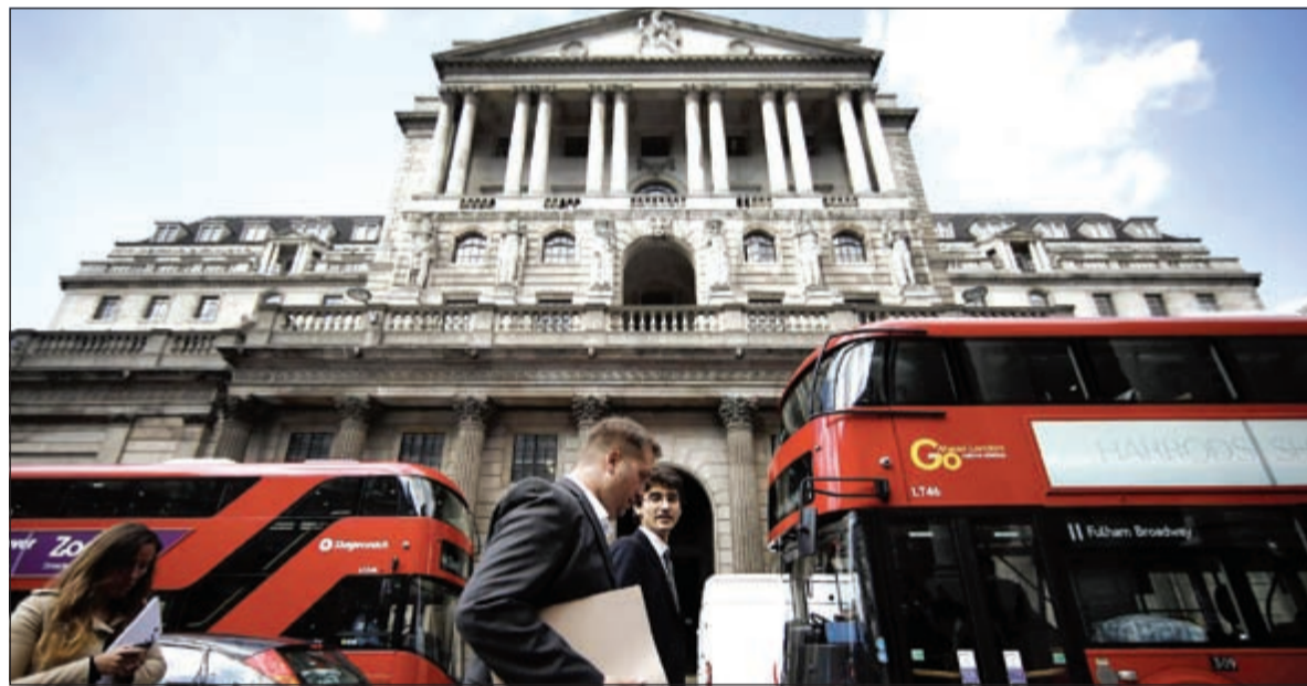
خروج بريطانيا من الاتحاد الأوروبي قد يضعف القومات الائتمانية للبنوك في المملكة المتحدة

ضعف الطلب على الائتمان على خلفية عوامل عدة منها تزايد حالة الشكوك وغياب اليقين، وزيادة تكلفة المخاطر نتيجة لتدني قيمة نوعية الأصول، ناهيك عن الضغوط على هوامش الفائدة فيما تبقى أسعار الفائدة عند مستوياتها الدنيا لفترة أطول. ولا شك أن بعض البنوك البريطانية التي تعتمد في الوقت الحاضر على قدرتها على اقتحام السوق الأوروبية الموحدة ستضطر إلى تحمل أعباء مالية إضافية لإعادة ترتيب وتصميم نماذج نشاطاتها حتى تكون قادرة على الاستمرار في خدمة عملائها الأوروبيين.