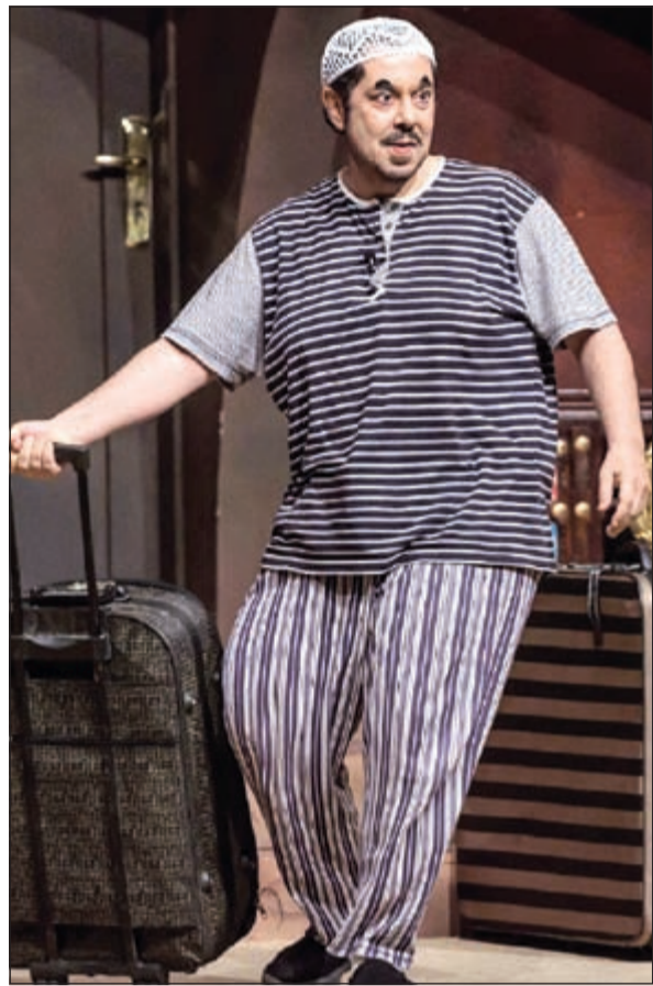
النجم عبدالعزيز المسلم في «البيت المسكون»