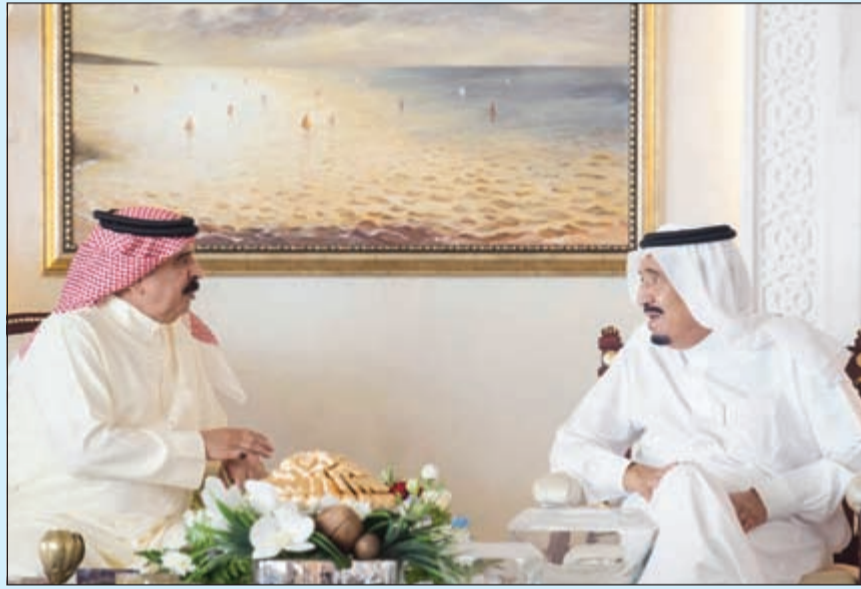
خادم الحرمين الشريفين الملك سلمان بن عبدالعزيز مستقبلاً عامل البحرين الملك حمد بن عيسى

عواصم - وكالات: استقبل خادم الحرمين الشريفين الملك سلمان بن عبدالعزيز في مقر إقامته بمدينة طنجة امس الأول، أهل البحرين الملك حمد بن عيسى آل خليفة. وذكر وكالة «واس» أنه جرى خلال اللقاء استعراض العلاقات الأخوية بين البلدين الشقيقين. في غضون ذلك، ترأس صاحب السمو الملكي الأمير محمد بن سلمان ولي ولي العهد النائب الثاني لرئيس مجلس الوزراء وزير الدفاع السعودي وفد المملكة في الاجتماع الثاني لوزراء الدفاع للتحالف الدولي لمحاربة تنظيم داعش الذي استضافته واشنطن أمس. وناقش الاجتماع تطورات سير العمليات العسكرية للتحالف الدولي في محاربه لداعش وعددا من المسائل المتعلقة بهذا الشأن. من جهة أخرى، قام سمو الشيخ محمد بن زايد آل نهيان ولي عهد أبوظبي بزيارة قصيرة إلى الدوحة، حيث أجرى مباحثات مع سمو الشيخ تميم بن حمد آل ثاني أمير قطر. وناقش الجانبان قضايا إقليمية ودولية ذات اهتمام مشترك بين البلدين.