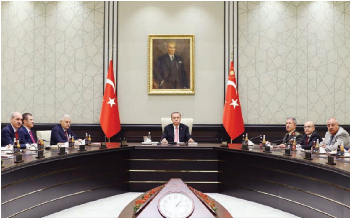
الرئيس التركي رجب طيب اردوغان مترئساً اجتماع مجلس الامن القومي الطارئ

عواصم - وكالات: عقد الرئيس التركي رجب طيب اردوغان جلسة طارئة لحكومته مع مجلس الامن القومي أمس، في وقت كشفت تفاصيل محاولة الانقلاب الفاشلة، وبالترزامن مع استمرار حملة التطهير. وقالت مصادر اعلامية ان المحققين عثروا على وثيقة تشير إلى أن المخططين للانقلاب كانوا ينوون اتهام الرئيس بمساعدة منظمة «حزب العمال الكردستاني» المحظورة في البلاد. وأكد مسؤول حكومي ما نقلته وكالة «الاناضول» التركية للأنباء من أن الاتهامات كانت ستوجه أيضاً إلى رئيس الوزراء السابق أحمد داود أوغلو ورئيس المخابرات هاكان فيدان. وكان الاتهام سيستند إلى عملية السلام بين الحكومة وقيادة حزب العمال الكردستاني التي بدأت بصورة سرية عام 2009 وانهارت في النهاية العام الماضي. في هذه الأثناء وأصلت السلطات ما عرف بـ «عملية التطهير» حيث جرى فصل أو اعتقال نحو 50 ألفاً من العسكريين و أفراد الشرطة والقضاة والموظفين الحكوميين والمعلمين منذ فشل محاولة الانقلاب وهو ما أثار التوترات داخل الدولة.