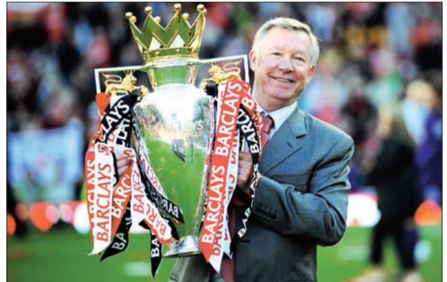
فيرغسون أسطورة مان يونايتد

كأس الاتحادات والمسابقات القارية. ويعتبر السير اليكس فيرغسون الأفضل في تاريخ الدوري والذي أصبح إيقونة لاعبة، لكونه الأكثر تتويجا به بعدما فاز به 13 مرة مع نادي مان يونايتد، حيث يعد آخر مدرب من إسكتلندا نجح في إحراز اللقب الممتاز، بينما لم يتمكن أي مدرب من مواطنيه من تكرار الإنجاز منذ اعتزاله التدريب صيف عام 2013. ويحل بعد السير من حيث رصيد الألقاب التي نالها بالدوري الإنجليزي، مواطنه جورج رامزي الذي قاد استون فيلا للتتويج باللقب لسته