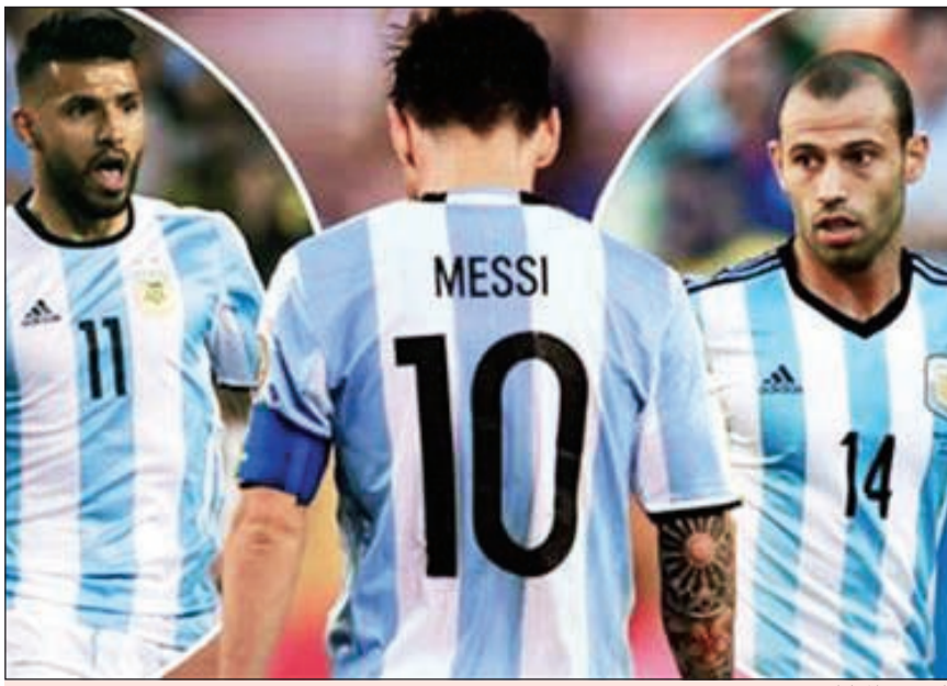
إلى متى المعاناة؟