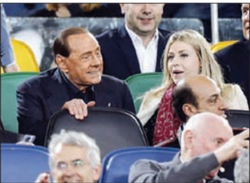
برلسكوني ونهاية حقبة

تتجه إدارة نادي ميلان الإيطالي في الفترة المقبلة إلى تأجيل حسم الصفقات الجديدة بسبب انشغالها بعملية بيع النادي للمستثمرين الصينيين. وأشارت صحيفة «لاغازيتا ديللو سبورت» الإيطالية إلى أن عملية البيع لن تتم قبل انتهاء شهر يوليو الحالي، في ظل عدم حسم الأمور بين الطرفين حتى منتصف شهر يوليو، مثلما كان مقررا من قبل، مما جعل إدارة النادي توقف التفكير في كل شيء آخر والتركيز فقط في عملية البيع. وسيكلف بيع النادي للمستثمرين الصينيين 500 مليون يورو، سيتم تقسيمها على دفعتين الأولى قيمتها 400 مليون يورو، فيما ستكون الثانية قيمتها 100 مليون يورو. يذكر أن ميلان كان قد أعلن فقط عن مدربه الجديد وهو مونتيللا، بعد انتهاء عقد المدرب المؤقت بروكي مع الفريق.