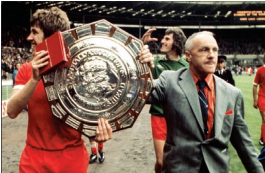
شانكلي رمز ليغربول

مواسم، كما فاز معه أيضا بستة ألقاب في مسابقة كأس الاتحاد، حيث لا يتفوق عليه في لقب هذه البطولة سوى الفرنسي آرسين فينغر. ويأتي بعدهم السير مات بيسي الذي سبق فيرغسون لتحقيق مجد الشياطين الحمر بعدما قادهم لإحراز الدرع خمسة مواسم، كما فاز معهم بلقب دوري أبطال أوروبا، وهو أول مدرب يقود ناديا إنجليزيا لإحراز هذا اللقب. ونجح بسدوره كيني دالغليش في التتويج باللقب أربع مرات، منها ثلاث مرات مع ليغربول، بينما كانت المرة الرابعة مع نادي بلاكبيرن ورفرز في موسم 1994-1995.