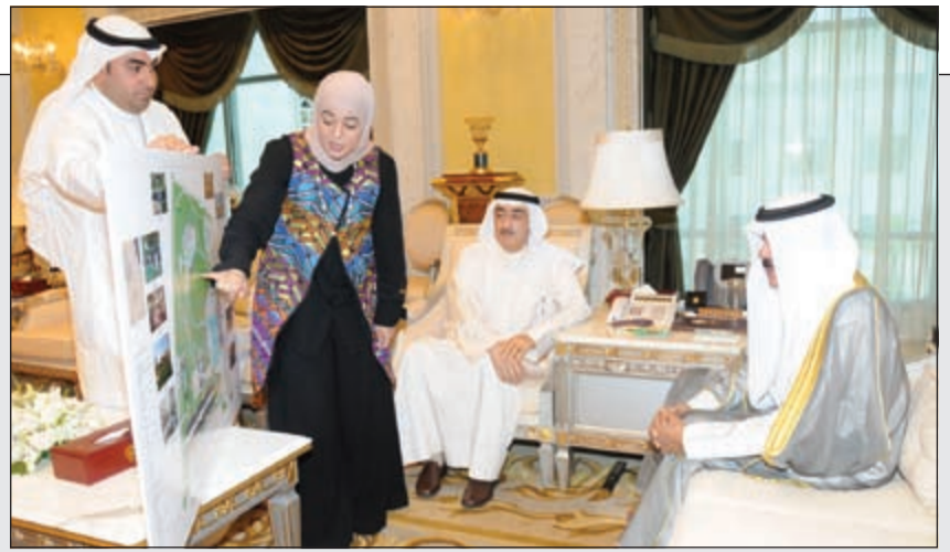
سمو نائب الأمير وولي العهد الشيخ نواف الاحمد يستمع لشرح عن منتزه نواف الاحمد

نائب الأمير: منتزه نواف الأحمد صرح معماري سيسهم في دفع عجلة التنمية