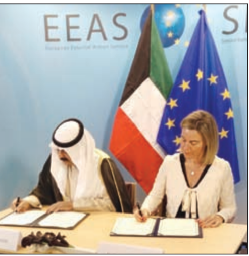
خالد الجارالله وفيدريكا موغريني لدى توقيع الاتفاقية

بروكسل - كونا: وقع نائب وزير الخارجية السفير خالد الجارالله مذكرة تفاهم لتعزيز التعاون بين الكويت وجهاز العمل الخارجي الأوروبي في عدة مجالات. وقال الجارالله في تصريح مشترك لـ «كونا» وتلفزيون الكويت ان «هذه المذكرة التي وقعها مع الممثلة العليا للسياسة الخارجية والأمنية في الاتحاد الأوروبي فيديريكا موغريني تمنح الكويت فرصة للتعاون مع الاتحاد في عدة مجالات كالطاقة والاستثمار وتعزيز المساعدات التي يقدمها الاتحاد للدول الأفريقية». وذكر ان الاتحاد الأوروبي ومجلس التعاون عقدا مفاوضات منذ سنوات لتوقيع اتفاقية للتجارة الحرة، أملا أن يجري توقيعها في أقرب وقت ممكن.