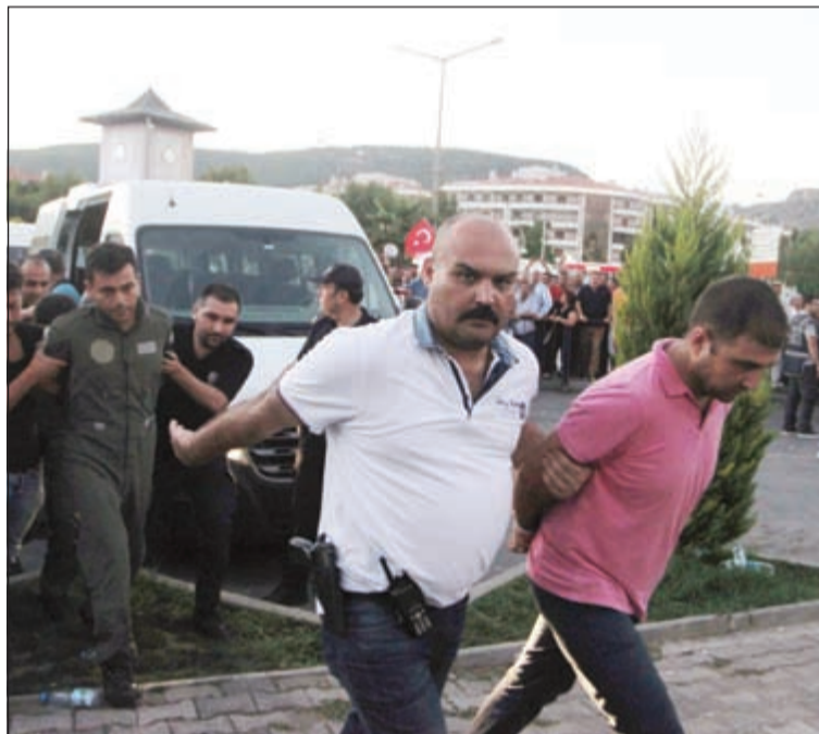
رجال الشرطة والأمن يقنطون معتقلين متورطين في الانقلاب إلى محكمة مرمريس

أنقرة - وكالات: قال مسؤول بالرئاسة التركية إن جنديا تركيا فتح النار أمام المحكمة الرئيسية بالسلطات، مضيفا أنه لم يتم الإبلاغ عن أي ضحايا بشرية.