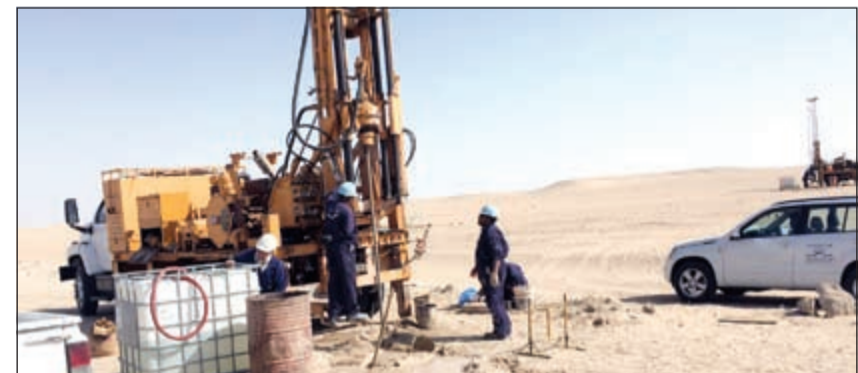
تركيب أجهزة فحص التربة ومنسوب المياه

أماكن مضخات المياه بالدولة قد باشرت أعمالها صباح أمس الأول حيث تم تحديد ثلاث نقاط تقع في الكيلوات رقم 12 و18 و15 لتركيب المضخات المائية في حين تم توزيع 120 جهازاً لفحص التربة لبيان نسب المياه ومدى عمقها، لافتاً إلى أن اللجنة التطوعية لأهالي المطالع تعمل بكل جد ومثابرة وفق جدول زمني محدد لأداء مهامها بالنسبة للمتابعة والملاحظة والمساعدة