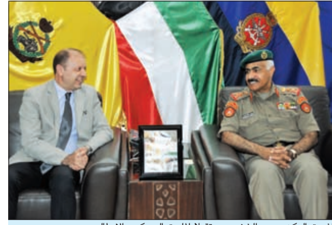
الفريق الركن محمد الخضر مستقبلاً الملحق العسكري الإيطالي