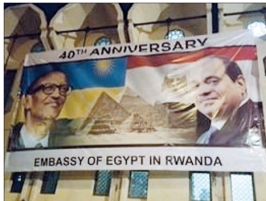
لافتة ضخمة تحمل صورة الرئيس السيسي ونظيره الرواندي على واجهة مبنى السفارة المصرية في كيجالي

القارة السمراء، مثنين ما يقوم به الرئيس السيسي لجهة إعادة العلاقات التاريخية التي تربط بين مصر وإشقائها في أفريقيا.