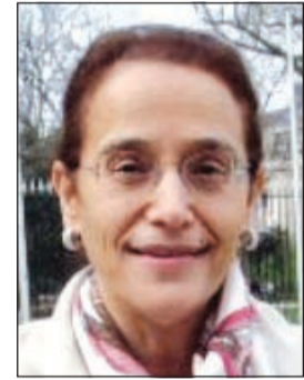
السفيرة أمل الحمد