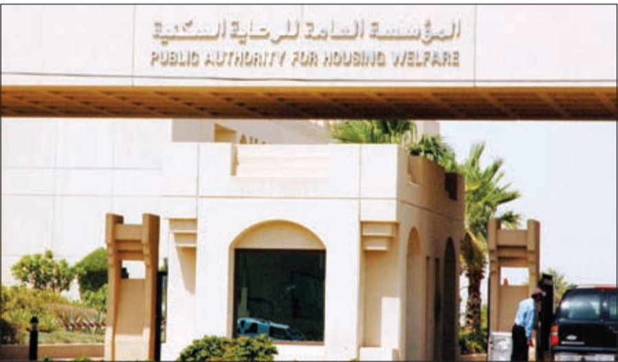
مبنى المؤسسة العامة للرعاية السكنية

ان اختبار نوعية البناء سواء كانت شقق او بيوت يرجع الى رؤية مجلس ادارة المؤسسة العامة للرعاية السكنية بعد عرض التخصص والتصميم للمشروع عليهم وتحديد اعداد الوحدات السكنية المتاحة وذلك حسب ما نص عليه قانون 2015/2.