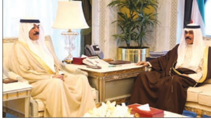
سمو نائب الأمير مستقبلاً الشيخ محمد الخالد