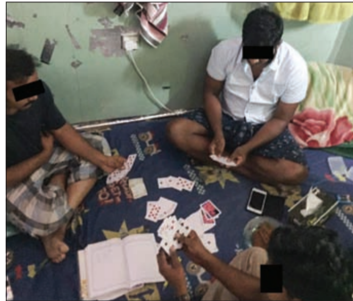
مدير المقهى وأدوات القمار

أمر مدير عام مديرية أمن الفروانية العميد ركن صالح العنزي بإحالة 8 مقامرين أسبويين إلى إدارة الإبعاد الإداري مع إدراج أسمائهم على قوائم غير المصرح لهم بدخول البلاد مجدداً. وبحسب مصدر أمني فإن معلومات وردت إلى العميد العنزي عن استغلال مقهى إنترنت في الفروانية في لعب القمار حيث أقيم المقهى غرفة مغلقة خصصت للقمار مقابل 5 دنائير لكل شخص يريد أن يدخل إليها يأخذها مدير المقهى. ومضى المصدر بالقول إنه تم إرسال مصدر للتأكد من استغلال الغرفة الكائنة في المقهى في القمار حيث أعطى المصدر الإشارة لقوة أمن الفروانية وضبط بداخل الوكر 8 رجال وأوراق اللعب.