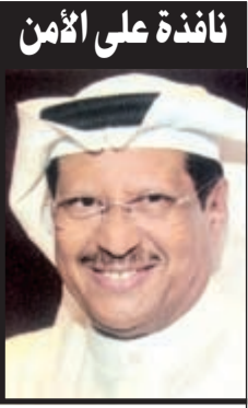
نافذة على الأمن

الأمني العميد: إن صفة المحامي - مع كل التقدير والاحترام لها - ليست ترخيصاً بتجاوز القانون أو تفويضاً بانتهاكه، مؤكداً أن الداخلية تحتفظ بحقها في الرد على هذه المزاعم والادعاءات عن طريق القانون، وأنه إذا كانت المؤسسة الأمنية ترفض أي تجاوز بحق كائن من كان مواطناً أو محامياً أو غيره، فإنها أيضاً لا تسمح بأي تجاوز في حق رجل الأمن وهو يؤدي مهام عمله في موقعه ومن ضمن واجبه ومسؤولياته.