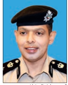
العميد عادل الحشاش

أكد مدير عام الإدارة العامة للعلاقات والإعلام الأمني بوزارة الداخلية العميد عادل الحشاش أن الادعاءات التي ردها أمين سر جمعية المحامين عن تعرض محام للإهانة على يد رجل أمن بمخفر صباح السالم مساء الثلاثاء الماضي لا سند له من الواقع، وتتناقض مع كل الوثائق التي تحت يد وزارة الداخلية، مشيراً إلى أن المؤسسة الأمنية لا يمكن أن تقبل بقلب الحقائق وترديد أقاويل لا أساس لها من الصحة، وخاصة إذا كانت تملك ما يؤكد ذلك