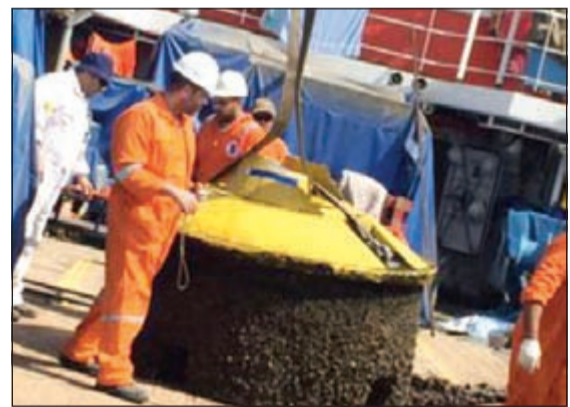
العوامة بعد انتشالها

مع العوامة الغارقة حتى تم انتشالها بالتنسيق مع شركة نفط الكويت. وحضت الإدارة العامة