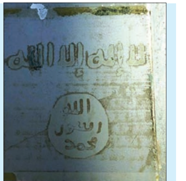
بوستر علم داعش