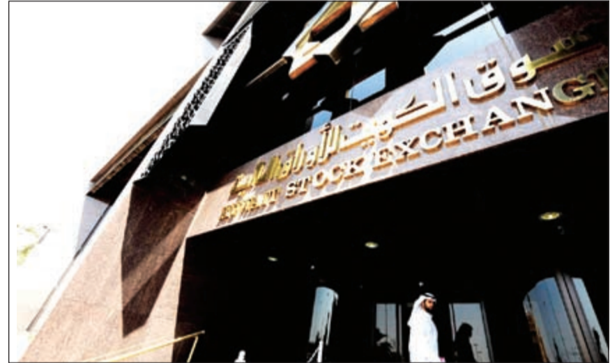
34٪ تراجع سيولة السوق في النصف الأول إلى 1,5 مليار دينار

قال تقرير الشال إن الحديث يكتر أحياناً عن تسليبات انسحاب شركات من الإراج في بورصة الكويت، ونحن نحترم مثل ذلك الرأي، ولكننا لا نتفق معه، فالبورصة الحالية أصبحت بخصائص مختلفة عن متطلبات بورصة ما قبل سبتمبر 2008، وما لحقه من 7 سنوات عجاف، بدأت بإزمة دبي المالية، ثم أزمة ديون أوروبا السيادية، ثم الربيع العربي، ومؤخراً انهيار أسعار النفط وفقدانها نحو 57٪ من مستواها في عام 2013. قبل سبتمبر من عام 2008، كان مجرد إراج الشركات وتداول أسهمها يمثل أهم مصادر الربحية، لذلك كان تفرغ الشركات خط إنتاج رئيسياً ترتبت عليه حيازة بورصة الكويت على أكبر عدد من الشركات المدرجة مقارنة بكل بورصات إقليم الخليج - بلغت 217 شركة حتى شهر يونيو 2011- وحينها كانت المراهنة على نفع أسعارها هدفاً رئيسياً.