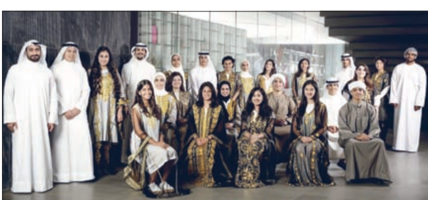
من المشاركين في برنامج البروتيجيز

قد بدأت بالفعل منذ بداية العام الحالي 2016 من خلال عمل زيارات للجامعات والمدارس إلى جانب المشاركة في الفعاليات الأخرى للتعريف بالبرنامج وذلك لخلق الشباب فرصة التسجيل هذا العام. وبدأ البرنامج نشاطه في العاشر من يوليو لهذا العام وستكون مدته 6 أسابيع مقسمة إلى أسبوعين خارج الكويت بالتعاون مع كلية بوسطن و4 أسابيع داخل الكويت. ويمكن الراغبين الالتحاق بالبرنامج للسنة القادمة عن طريق تقديم طلبات التسجيل عبر الموقع الإلكتروني: www.theproteges.org