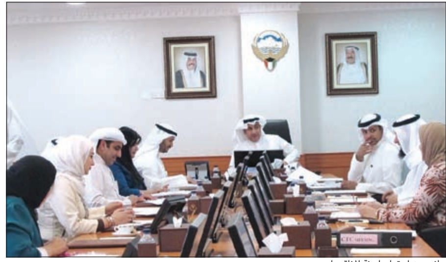
جانب من اجتماع لجنة المناقصات