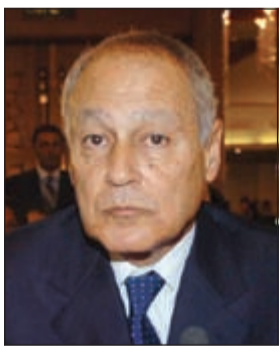
أحمد أبو الغيط