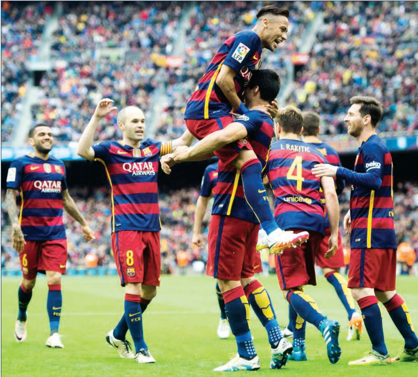
هل تستمر هيمنة برشلونة على الليغا في الموسم الجديد؟

سانتياغو برنابيو بمدريد في 23 أبريل المقبل. ويختتم برشلونة المسابقة بلقاء أيبار في الجولة الـ 38 والأخيرة في حين يقابل ريال مدريد فريق ملقا أما أتلتيكو مدريد فيبجورتيغو الأبيس الصاعد حديثا لدوري الدرجة الأولى. وتأتي مباراة «الكلاسيكو» الأولى بين قطبي كرة القدم الإسبانية في الجولة الـ 14 في الرابع من شهر ديسمبر المقبل على أرض كامب نو في حين ستقام المباراة الثانية في الجولة الـ 33 بالمسابقة في