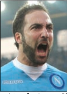
الأرجنتيني جونزالو هيفواين

تقدم فريق يوفنتوس، حامل لقب الدوري الإيطالي في الموسم الخمسة الأخيرة، بعرض مغر للتعاقد مع الأرجنتيني جونزالو هيفواين مهاجم فريق نابولي مقابل 75 مليون يورو، حسبما أفاد تقرير إخباري أمس.