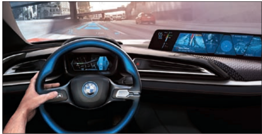
مجموعة واسعة من مزايا الحوسبة والاتصال والسلامة والأمن داخل السيارة