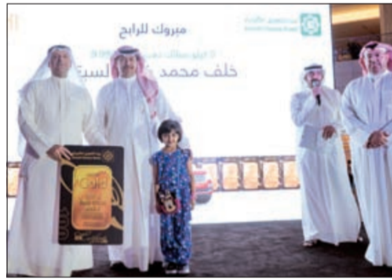
.. ويسلم الفائز جائزة «الذهب»

اختتم بنك الكويت الوطني ومؤسسة لويك غير الربحية الدورة الثانية من برنامج «بريدج»، وكان البنك قدم رعايته للبرنامج في إطار دعمه لنشاطات المؤسسة، وانطلاقاً من دوره الريادي في دعم المؤسسات المجتمعية والإنسانية الفاعلة، وتشمل رعاية البنك الوطني دعماً كاملاً لبرنامج «بريدج» وتوفير جهاز تدريبي من مديرين وبرامج متخصصة للمشاركين من متدربي «لويك»، ممن اجتازوا برامج تدريب تمهيدية سبقت إطلاق برنامج «بريدج» الذي يتألف من 4 دورات تمتد لغاية يناير المقبل، تأتي رعاية «الوطني» لنشاطات «لويك»، انطلاقاً من رسالته الاجتماعية الهادفة إلى دعم كافة شرائح المجتمع ومؤسساته وخاصة