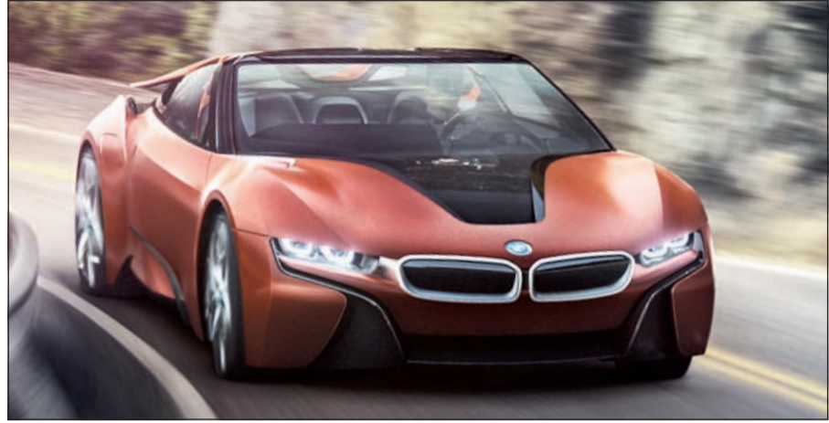
طراز BMW iNEXT