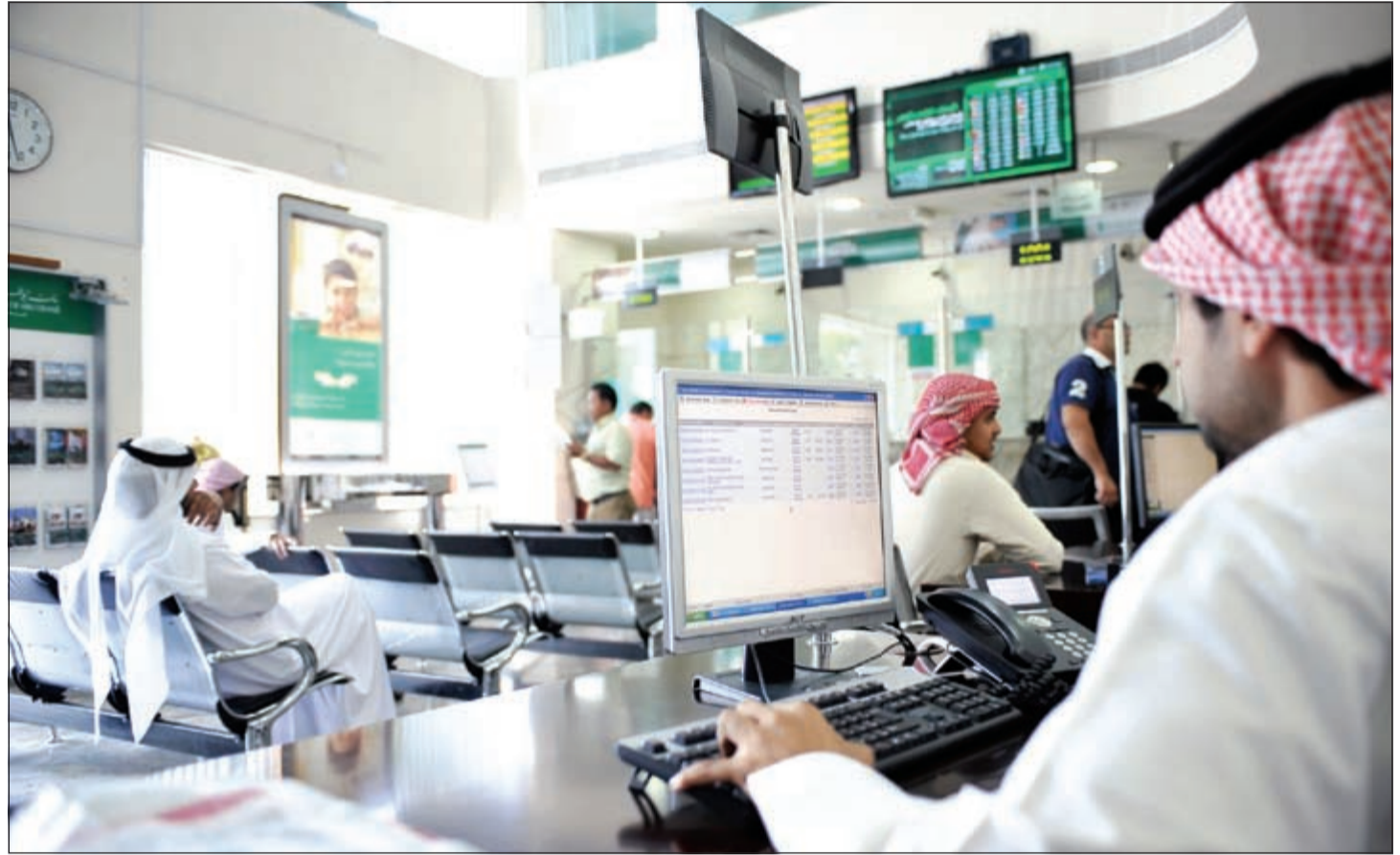
ارتفاع القروض هذا العام يتجاوز مستويات السنوات الخمس الماضية

آخر أخبار الاقتصاد المحلية والعالمية زوروا موقعنا على www.alanba.com.kw/Business