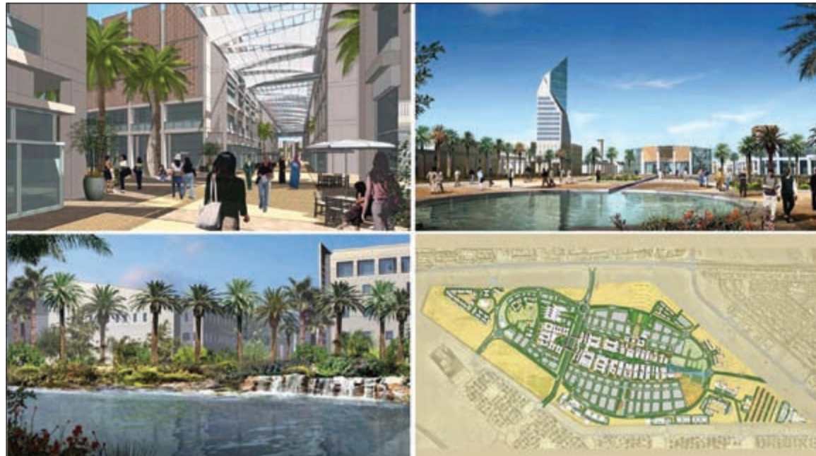
المخطط الهيكلي لمشروع مدينة صباح السالم الجامعية

كونا - ميرفت عبدالدايم: يترجم مشروع مدينة صباح السالم الجامعية (الشهادية) أحد أكبر المشاريع الإنشائية في الشرق الأوسط وأهمها، حرص الحكومة الكويتية على الارتقاء بالتعليم الجامعي في البلاد باعتباره محورا أساسيا للتنمية البشرية.