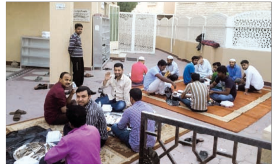
جانب من مشروع إفطار الصائم في مسجد أبو ريمية بمنطقة صباح الناصر

كرّم القائمون على مسابقة المغفور لها بإذن الله تعالى لطيفة عبدالله النهيب العدوانى «أم مدرسة»، وذلك للمصليات في مسجد أبو ريمية الكائن بمنطقة صباح الناصر. وتهدف المسابقة الى نشر العلم الشرعي، وتشجيع النساء على المشاركة في المسابقات الدينية تقديرا للنساء المؤمنات وللنهوض بأنشطة المسجد الرمضانية، حيث انحصرت المشاركة بين النساء والدخات ضيفات المسجد للفوز بالجوائز الموضوعه، وبالإجابة عن جميع الأسئلة المطروحة بشكل واضح. وكان من الأنشطة المميزة للمسجد خلال شهر رمضان المبارك إقامة إفطار الصائم، حيث كانت توزع هناك وجبات إفطار يوميا من المتطوعين من أبناء المنطقة تأكيداً لمشاعر التراحم بين المسلمين.