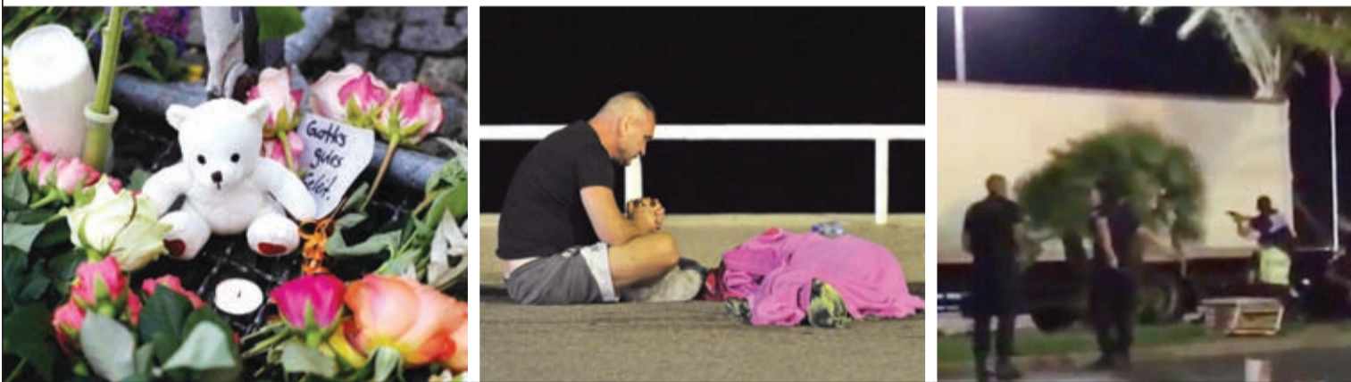
جثث ضحايا الهجوم الإرهابي في نيس وفي الإطار الشرطة الفرنسية تطلق النار على الشاحنة.. ورجل أمام جثة أحد اquareه.. وورود وألعاب في موقع الحادث

عواصم - وكالات: خلال احتفالاتها بالعيد الوطني، تعرضت فرنسا لهجوم إرهابي حوّل فرحتها إلى مأساة حصدت حياة أكثر من 84 قتيلاً، وأوقعت نحو 202 جريح، بينهم 50 في حالة حرجة، في مدينة نيس الفرنسية. وفيما كان الآلاف يشهدون الاحتفالات بـ «يوم الباستيل» على شواطئ الكوت دازور، اندفع السفاح الفرنسي ذو الأصول التونسية ويدعى محمد بوهلال، بشاحنته الكبيرة إلى المحتشدين في «ساحة الأنجلين» ودهس وقتل العشرات ومعظمهم من الأجناب والأطفال. ورجحت تقارير إعلامية وقوف «داعش» وراء الهجوم الذي حظي بإدانة دولية واسعة، ووقع الهجوم فيما كانت فرنسا تتحضر لرفع حالة الطوارئ السارية منذ اعتداءات نوفمبر الماضي بعد أيام قليلة، حيث أعلن الرئيس الفرنسي فرانسوا هولاند تمديدتها لـ 3 أشهر إضافية. وحذر الرئيس الفرنسي مما وصفه بـ«تهديد الإرهاب الإسلامي»، وأعلن زيادة التدخل الفرنسي في الحرب ضد «داعش» في العراق وسورية، مؤكداً أن بلاده ستخوض حرباً طويلة ضد هذه الآفة. التفاصيل من 18 و19