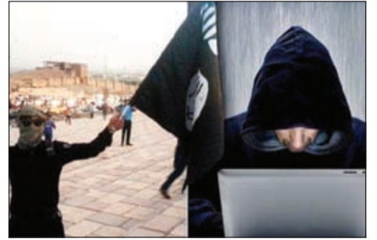
حواسيب «داعش» تحوي أفلاماً إباحية

80% من ذاكرة حواسيب عناصر «داعش» تحوي أفلاماً إباحية