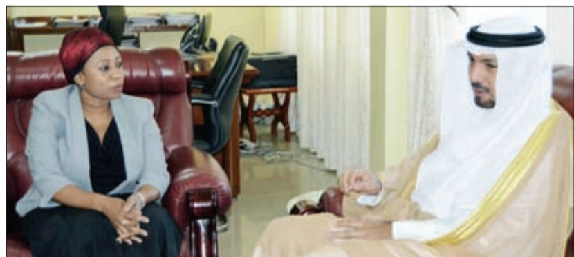
السفير جاسم التاجم خلال لقائه وزيرة الصحة والتنمية الاجتماعية التنزانية

المرضى وإجراء العمليات الجراحية بتقنيات حديثة. وقالت سفارتنا لدى تنزانيا إن تعليمي أيدت خلال اللقاء كذلك رغبة بلادها في تبادل الخبرات بين البلدين في مجال الشؤون الاجتماعية والاهتمام بالمرأة وتحسين أوضاعها خاصة أن الكويت متقدمة في هذا المجال. وأشارت بد النشاط الكبير، للجمعيات الخيرية الكويتية العاملة في بلادها ودورها في قطاع الصحة والتنمية الاجتماعية.