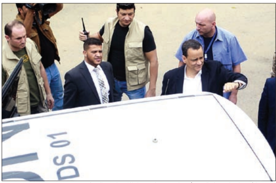
المبعوث الأممي اسماعيل ولد الشيخ أحمد لدى وصوله صنعاء للاجتماع مع الحوئيين

عواصم- وكالات: غادر اسماعيل ولد الشيخ، المبعوث الأممي لدى اليمن أمس الخميس العاصمة اليمنية صنعاء، مع وفد جماعة أنصار الله الحوثية للمفاوض، وحزب الرئيس اليمني السابق، علي عبد الله صالح، من أجل استئناف مشاورات الكويت. وقال مصدر في مطار صنعاء الدولي لوكالة الأنباء الألمانية (د.ب.أ) إن ولد الشيخ غادر المطار مع وفد جماعة الحوثي وحزب صالح على متن طائرة عمانية متجها إلى مسقط. وتوقع المصدر أن ينتقل ولد الشيخ مع وفد «الحوثي-صالح» بعدها إلى العاصمة الكويتية، من أجل العمل على استئناف المشاورات. وفي سياق قريب تتجه الحكومة اليمنية إلى عدم المشاركة في مشاورات السلام التي ترعاها الامم المتحدة في الكويت ومن المقرر استئنافها اليوم الجمعة، مشترطة الحصول على ضمانات بالتزام الحوثيين بالقرار الدولي 2216 الصادر عن مجلس الأمن الدولي، بحسب ما افاد مسؤول في الرئاسة اليمنية الخميس. وقال مصدر في الرئاسة اليمنية موجود في الرياض لوكالة فرانس برس مفضلاً عدم كشف اسمه ان على المنظمة الدولية «ان تأتي بضمانات مكتوبة من الطرف الآخر بلتزم فيها بمحددات المشاورات ومرجعياتها المتفق عليها»، وبرزها القرار 2216. والمتهمين من المدن التي سيطروا عليها منذ 2014 وابرزها صنعاء، وتسليم الاسلحة الثقيلة. وردا على سؤال لفرانس برس، اكد المتحدث باسم المبعوث الخاص للامين العام للامم المتحدة اسماعيل ولد الشيخ أحمد ان الأخير «سوف يعود الى الكويت اليوم (الجمعة) على ان تستأنف الجلسات اليوم كما هو مقرر»، واضاف «لم يعلن أي وفد عدم مشاركته حتى الآن».