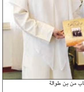
الشيخ فواز الخالد يتلقى نسخة الكتاب من بن طوالة

أكد محافظ الأحمدى الشيخ فواز الخالد، أن الكويت غنية بإرثها التاريخي، ومعالمها الشاهدة على تطور الحياة في مناطقها كافة، قبل وبعد اكتشاف النفط، منوها إلى أهمية تناول الباحثين والمؤرخين لتاريخ الكويت وتوثيقه، مع الحرص على نشره بين أوساط الجيل الحالي، للاطلاع على مسيرة الرعي الأول من الآباء والأجداد، الذين أسهموا فيما نحن فيه اليوم من أمن ورفاه، والافتقار بهم لدفع مسيرة التنمية والتطور في