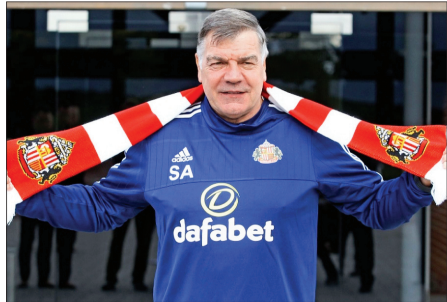
مدرب ساندرلاند سام الألدرايس يدخل في مفاوضات لتدريب إنجلترا

يبدو سام الألدرايس مرشحاً قوياً لتولي تدريب منتخب إنجلترا لكرة القدم وفق ما أورده ناديه ساندرلاند الإنجليزي أمس، والذي سمح لمديره الفني بيده مفاوضات بهذا الصدد مع الاتحاد الإنجليزي للعبة. ورشح الألدرايس (61 عاماً) لتدريب منتخب الأسود الثلاثة منذ عشرة أعوام، قبل أن تسند المهمة آنذاك إلى ستيف ماكلايرين. وتباحث المدرب المخضرم مع ثلاثة أعضاء في الاتحاد الإنجليزي الثلاثة حيال توليه مهمة الإشراف على منتخب إنجلترا خلفاً لروي هودجسون الذي استقال من منصبه غداة سقوط الإنجليز المدوي بواقع 2-1 أمام إسبانيا في ثمن نهائي كأس أوروبا 2016.