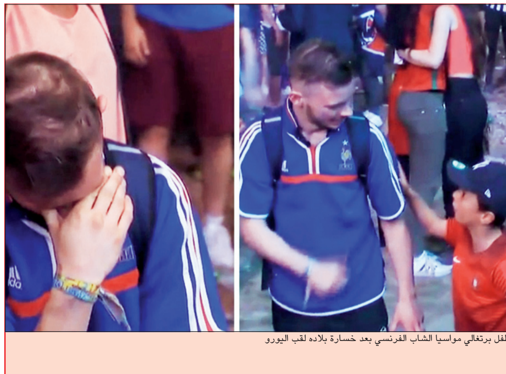
طفل برتغالي يواسي الشاب الفرنسي بعد خسارة بلاده لقب اليورو

سيحظى المشجع الفرنسي الذي انتشرت صورته وهو يجهدش بالبكاء بعد خسارة بلاده نهائي كأس أوروبا 2016 لكرة القدم قبل أن يواسيه طفل يرتدي قميص المنتخب البرتغالي، بفرصة زيارة البرتغال بدعوة من الوكالة الوطنية للترويج السياحي. وانتشر مقطع فيديو يظهر مشجعاً فرنسياً يبكي بعد خسارة البلد المضيف أمام البرتغال 0 - 1 في النهائي قبل أن يقرب منه طفل يرتدي القميص البرتغالي من أجل مواساته، وعندما كان الأخير في طريقه لمغادرة المكان اقرب منه المشجع الفرنسي وقبله على رأسه ثم عانقه. وحظي هذا المشهد باهتمام جماهيري كبير ما دفع الوكالة الوطنية للترويج السياحي في البرتغال إلى توجيه دعوة للمشجع الفرنسي، قائلة في بيان: «(سلطات) السياحة في البرتغال تطلق نداء من أجل التعرف على المشجع الفرنسي بهدف دعوته لزيارة البرتغال». وأضافت ان اللقطة التي قام بها الطفل وهو ابن عائلة مهاجرة من البرتغال، «ترجمت المشاعر الجياشة التي ولدتها المباراة النهائية وأظهرت مدى لطافة وتسامح واصالة البرتغاليين»، مشيرة إلى أنها وجهت دعوة للطفل أيضاً. وتريد الوكالة من المشجع الفرنسي المجهول الهوية حتى الآن «أن يتعرف على البرتغال وأن يختبر الضيافة الحقيقية للبرتغاليين». واستقبلت البرتغال أكثر 10,2 ملايين سائح في 2015، بينهم 1,1 مليون فرنسي.