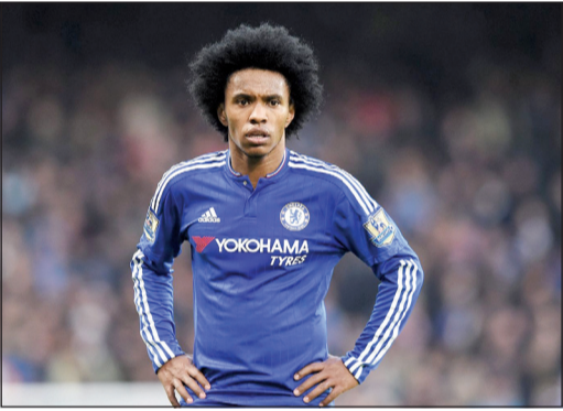
النجم البرازيلي ويليان

قرر تشلسي الإنجليزي تمديد عقد لاعب وسطه الدولي البرازيلي ويليان لأربعة أعوام إضافية بحسب ما أعلن النادي اللندني لكرة القدم أول من أمس. وأعرب ويليان (27 عاماً) الذي انضم إلى تشلسي قبل 3 أعوام من أنجي ماخاتشكالا الروسي مقابل 32 مليون جنيهه استرليني، عن سعادته بمواصلة المشوار مع النادي اللندني، قائلاً: «أنا سعيد جداً لتوقيع عقد جديد مع تشلسي، ومواصلة اللعب مع هذا الفريق يعتبر حلمًا، وخلال الأعوام الأربعة المقبلة سأحاول مساعدهته على الفوز بالمزيد من الألقاب».