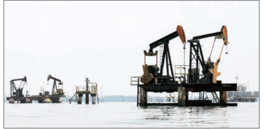
مستثمرو النفط قلقون بسبب عدم وضوح الرؤية حول أسعار الخام الذي أخذ يهبط من جديد بعد موجة ارتفاعات سابقة

ذكرت وكالة الطاقة الدولية ارتفاع مخزونات النفط حول العالم يهدد الاستقرار الحالي في أسعار الخام، رغم التحول من فائض المعروض إلى التوازن النسبي في الربع الثاني من العام الحالي. وأوضح الوكالة عبر تقرير صادر أمس، أنه مع إمكانية تراجع مخزونات الخام، إلا أنه في حال لم يرتفع الطلب بوتيرة تتجاوز التوقعات فإن مخاطر ارتفاع المخزونات بدرجة تهدد استقرار الأسعار الحالي يعتبر أمراً متوقعا.