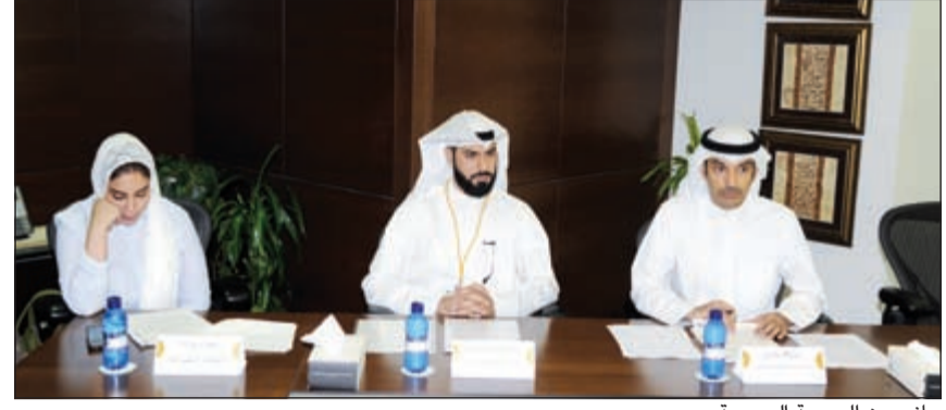
جانب من الجمعية العمومية

نواصل السعي لتعزيز المحفظة العقارية وتحسين جودة الأصول