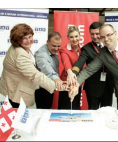
«العربية للطيران» تحفل بتسيير رحلتها إلى باتومي

وتقع باتومي على شواطئ البحر الأسود، وتتميز بتاريخها العريق وطبيعتها الأخاذة، وقد اشتهرت المدينة كوجهة آمنة ذات أسعار اقتصادية، ما يجعلها تستقطب المسافرين الباحثين عما هو أكثر من مجرد سياحة تقليدية.