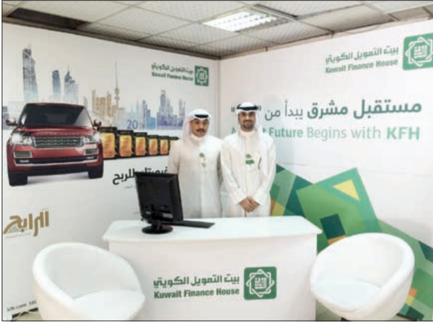
جناح «بيتك» في التربية

إلكترونيا من خلال خدمة الأون لاين، وكذلك تعريفهم بخدمة الإخطار الإلكتروني التي أطلقها «بيتك» لباقة خدماته الإلكترونية. ويهدف «بيتك» إلى تعزيز علاقته مع العميل واستهداف عملاء جدد، فيما يؤكد مكانته الرائدة ومركزه القوي وتميزه في تقديم باقة متكاملة من الخدمات والمنتجات النوعية التي تتوافق مع معايير الجودة وتتوافق مع أحكام الشريعة بما يلي متطلبات واحتياجات مختلف شرائح العملاء ويحقق طموحاتهم.