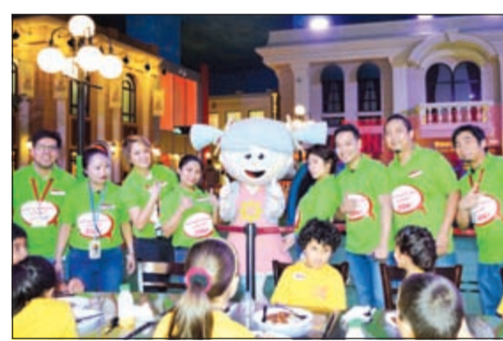
المشاركون أثناء وجبة الإفطار قبل بدء الأنشطة