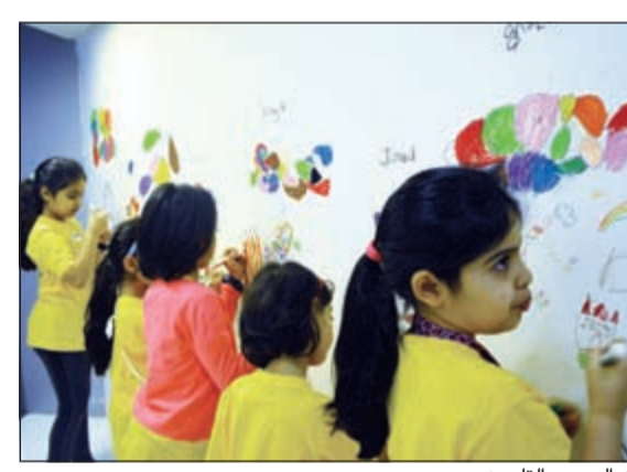
فن الرسم والتلوين