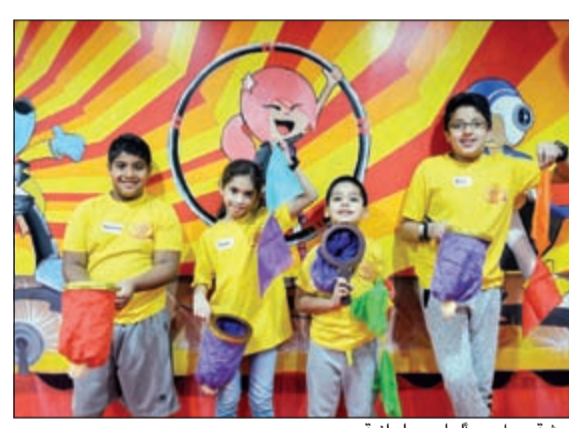
ورشة عمل.. ولعاب بهلوانية

والحرف اليدوية، وفنون الطبخ، وغيرها. ويوفر المخيم أيضا ورش عمل تعليمية مصغرة مخصصة للأطفال الصغار (من 2-4 سنوات) تركز على تطوير مهاراتهم الحركية، والجسدية، والذهنية، وتمنح في نفس الوقت الآباء والأمهات الفرصة لمشاركة أبنائهم مرح تلك الأنشطة وللتفاعل معهم في إطارها.