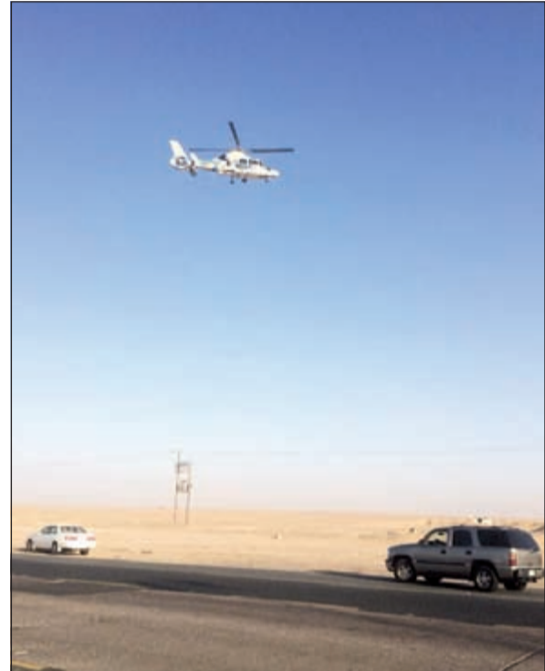
لا بد من تكاتف الجهود لمنع حوادث الإبل على طريق السالمي