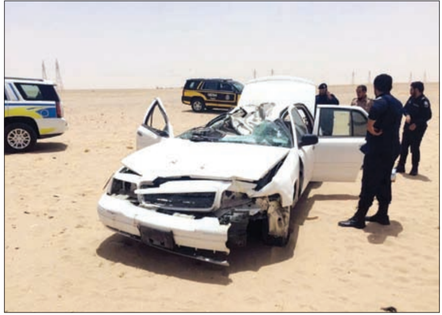
الشرطة تعالين احد الحوادث

في البداية، قال النائب محمد طنا ان هذه المشكلة سبق ان تحدثنا بشأنها مع وزير الاشغال لوضع السياج حول الطرقات خصوصاً في منطقة السالمي وهو طريق سفر يستغله الآلاف من المواطنين للسفر خارج البلاد لاسيما في فترة العطلة الصيفية. ولفت الى ان هناك العديد من الحوادث المرورية المروعة التي تحصل يومياً وتحصد العديد من الأرواح، متسائلاً من المسؤول عن تلك المشكلة؟ وطالب طنا وزارة الاشغال بالتعاون مع وزارتي الداخلية والبلدية للعمل على مخالفة كل من يقوم بعبور الإبل في تلك الطرقات، مشيراً إلى ان الحفاظ على الإبل ومنع خروجها في غير الأماكن المخصصة لها مسؤولية