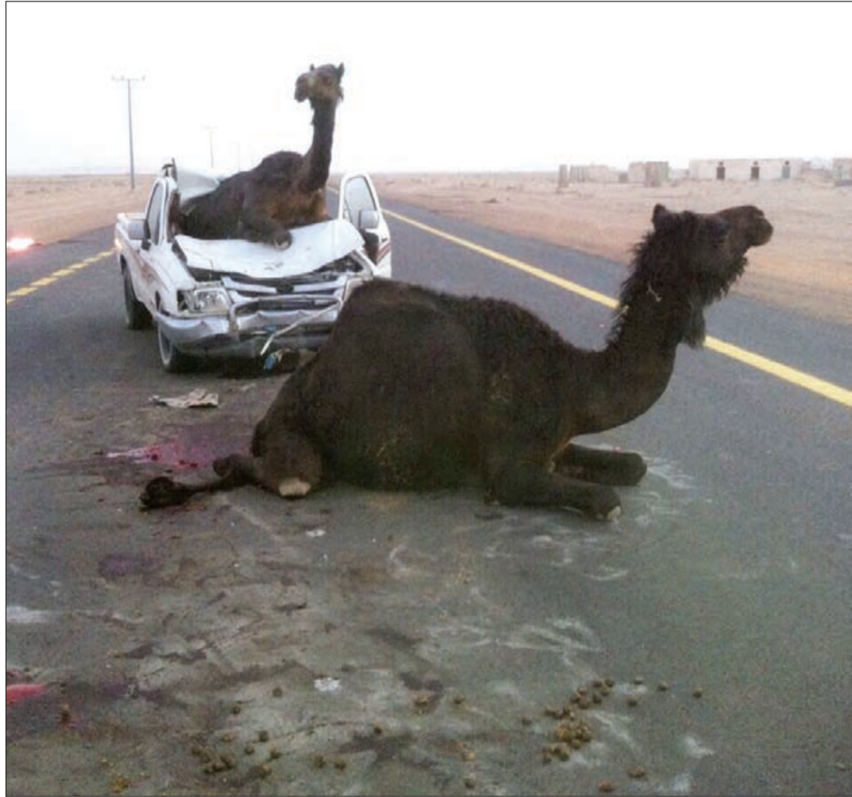
منظر يتكرر كثيرا على طريق السالمي