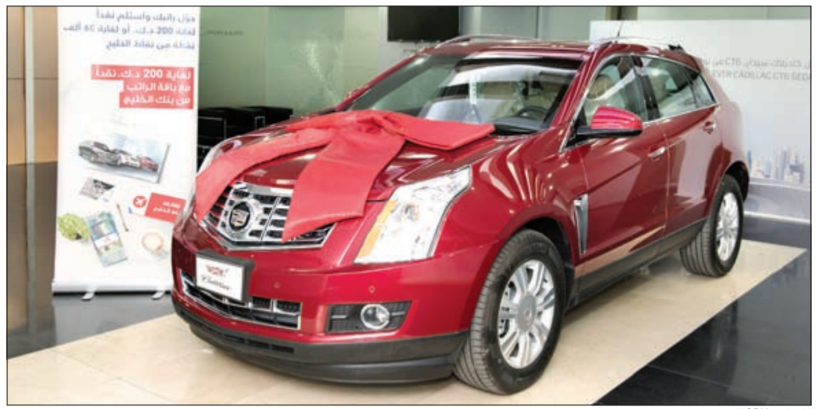
كاديلاك SRX الجديدة

أصحاب الحظ الوفير الذي سيفوز بسيارة كاديلاك SRX جديدة. ومعرفة المزيد حول حسابي الراتب red والسحوبات على الجوائز لدى بنك الخليج، يمكنك زيارة أي من فروع البنك البالغ عددها 56 فرعاً أو الاتصال بخدمة العملاء أو زيارة الموقع الإلكتروني للبنك.