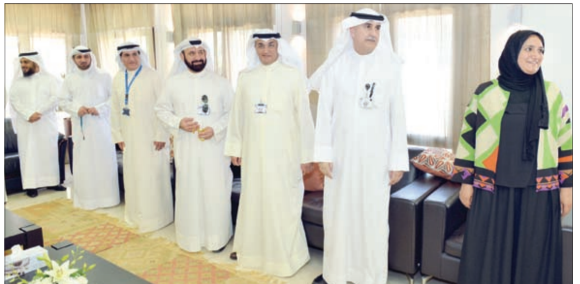
الرئيس التنفيذي لنفط الخليج ناصر الفليح متوسلاً الإدارة التنفيذية للشركة والرئيس التنفيذي لمؤسسة البترول الكويتية نزار العبداني خلال حفل الاستقبال

بالإضافة إلى المهنيين العاملين في المكتب الرئيسي وعمليات الوفرة المشتركة وعمليات الخفجي المشتركة والشركات الزميلة ووزارات وهيئات الدولة المختلفة، وذلك في حفل الاستقبال التي نظمتها الشركة في مقر مكتبها الرئيسي بالأمم المتحدة.