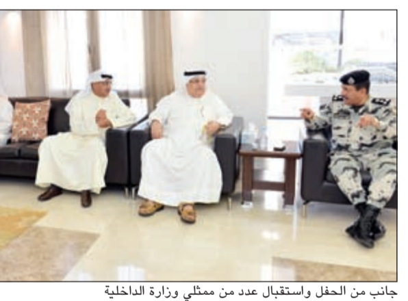
جانب من الحفل واستقبال عدد من ممثلي وزارة الداخلية