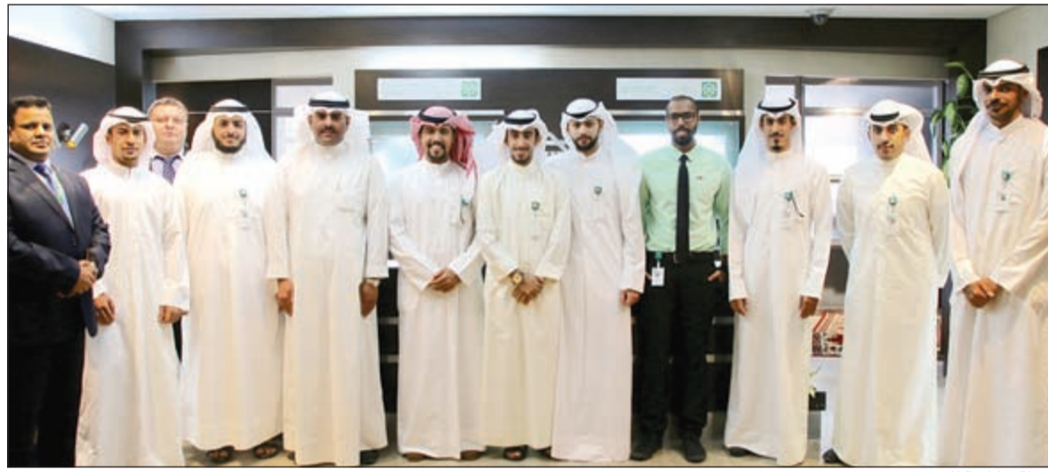
لقطة تذكارية للمتدربين

بهدف تعزيز روح الإبداع والابتكار لدى موظفي «بيتك» بما يتماشى مع متطلبات العملاء المتنامية للحفاظ على مكانة «بيتك» وريادته في السوق المصرفي. وتساهم هذه الموضوعات التي يتناولها البرنامج التدريبي بإثراء المعرفة المصرفية للموظفين الجدد من خلال وضعهم على الطريق الصحيح للقيام بمهامهم على أكمل وجه في خدمة العملاء باستخدام أحدث الأدوات والتقنية والبرامج المتوافقة مع المعايير العالمية للتكنولوجيا المصرفية، وكذلك تساهم في تقريب واقع العمل والتعرف بعمق على الأساليب المتبعة في العمل المصرفي والبرامج السلوكية وأنماط العملاء.