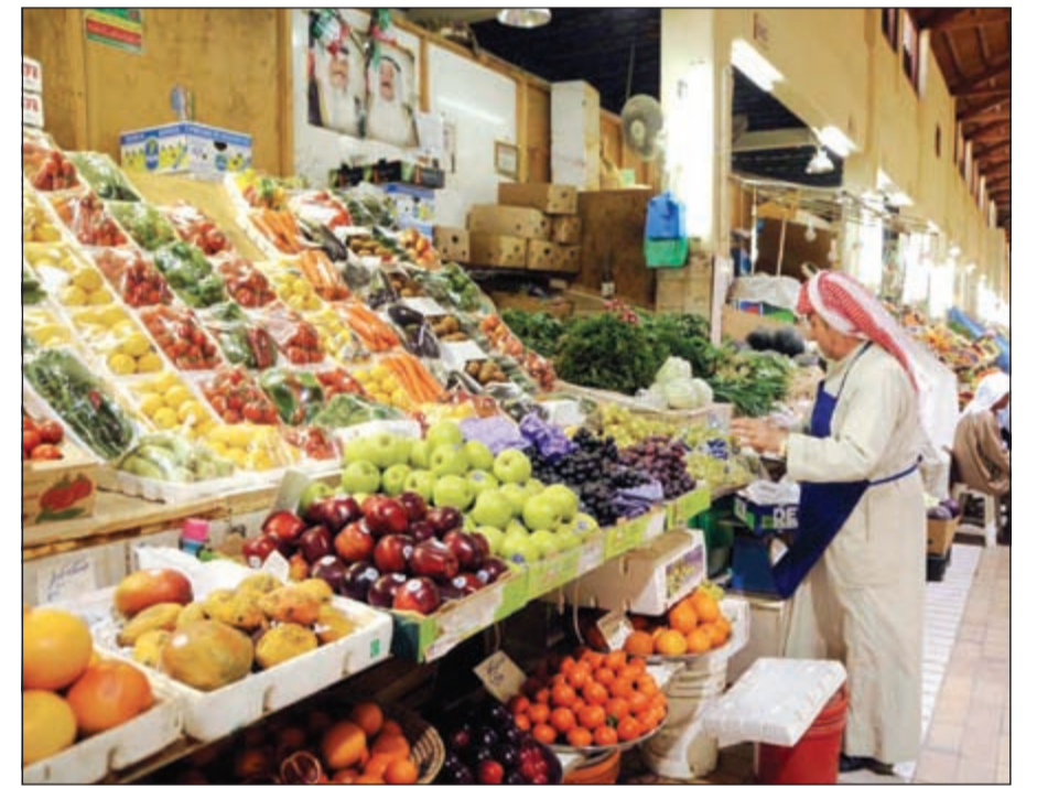
استمرار تراجع التضخم في أسعار الغذاء نتيجة تراجع أسعار المواد الغذائية العالمية

قال تقرير إدارة البحوث الاقتصادية في بنك الكويت الوطني: إن معدل التضخم في أسعار المستهلك تراجع خلال مايو الماضي ليصل إلى 2,8% على أساس سنوي، وذلك نتيجة لتباطؤ التضخم في أسعار المواد الغذائية، بينما ارتفع معدل التضخم الأساس