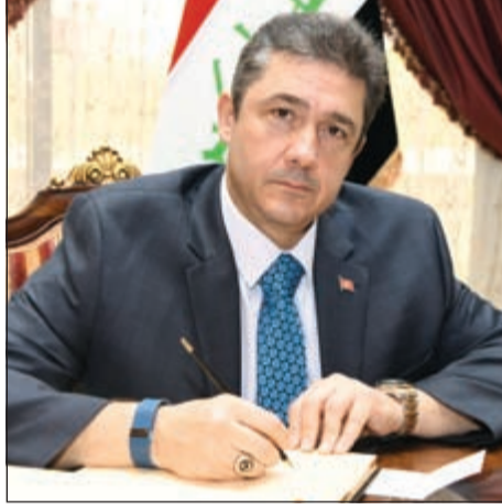
.. والسفير التركي معزيا