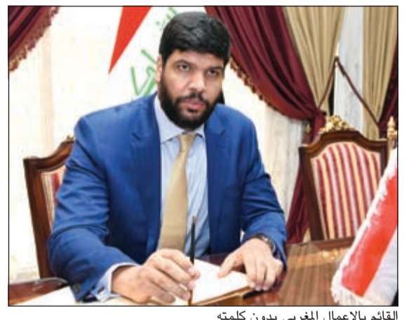
القيام بالأعمال المغربي يدون كلمته