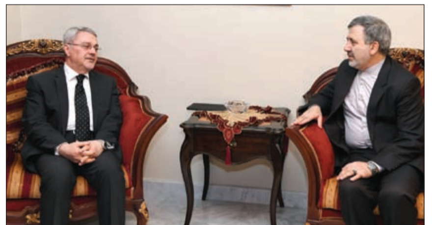
السفير الإيراني د.علي عنايتي يقدم التعازي