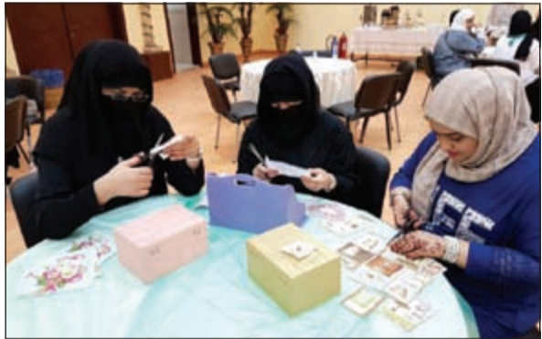
جانبا من الورش