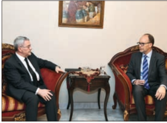
السفير الأميركي دوغلاس سيليمان مقبدا التعازي (محمد هاشم)

أكد مصدر مسؤول بوزارة المواصلات أن الوزارة ستشهد حركة تدوير وتعيينات في الوظائف الإشرافية وتشمل قطاعات البريد والإدارية والأمن والسلامة قريبا. وأضاف المصدر أن هناك ما يقارب 27 مديرا ومراقبا ستشمله حركة التدوير في القطاعات الثلاثة، وذلك لسد الوظائف الشاغرة في الوزارة والتي تشغل أغلبها بالإناطة.