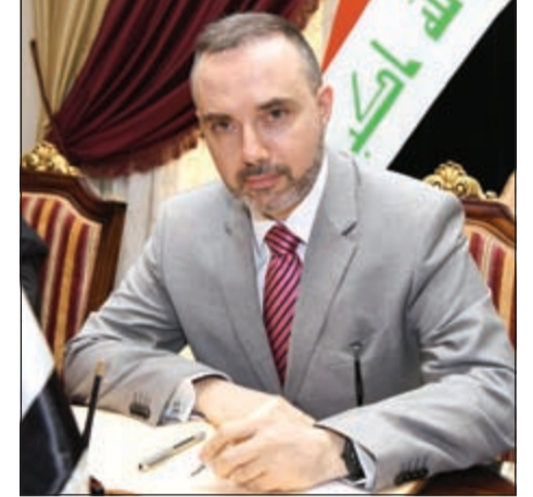
السفير الفرنسي يدون كلمة في سجل التعازي

أن العمليات الإرهابية التي تحدثت في العراق حاليا هي دليل نهاية الإرهاب، مضيفا أن العراق أحرزته في هذا الموقف المأساوي العسيف. من جهته، أعرب السفير الأميركي لدى البلاد دوغلاس سيليمان عن تعازي سفارة بلاده لجميع أسر الضحايا في العراق. وفي السياق ذاته، أوضح السفير الجزائري لدى البلاد عبدالحميد عبدواي