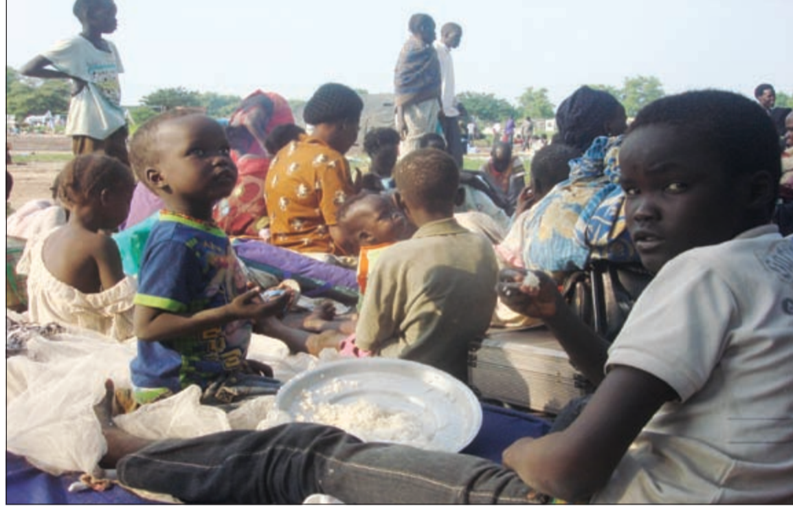
جزء من حوالي 3 آلاف مدني فروا من المعارك في جوبا

يلتقي مشار. وقد أعرب الأمين العام للأمم المتحدة بان كي مون في بيان له عن صدمته بسبب تجدد القتال العنيف في جمهورية جمهورية في صحتها على أفريقيا، وطالب مون الرئيس حالياً، ونائبه ببذل ما في وسعهم لتنهية الأعمال العدائية فوراً، وأن يأمر كل منهما قواته بفك الارتباط والانسحاب إلى قواعدهم، وقال أمين عام الأمم المتحدة إن هذا العنف لا معنى له وغير مقبول وسيؤدي إلى تراجع التقدم المحرز حتى الآن في عملية السلام.