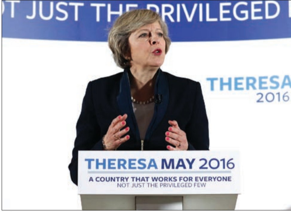
رئيسة الوزراء البريطانية المترتبة تيريزا ماي في مؤتمر صحفي في لندن أمس

وأضافت أنها تحظى بدعم عدد أقل من نواب الحزب في مجلس العموم وإن ذلك سيصعب عليها مهمة توحيد الحزب بعد التصدعات التي تعرض لها إثر تصويت البريطانيين على الخروج من الاتحاد الأوروبي. وقالت ليدسوم إن تيريزا ماي «تحظى بدعم 60٪ من حزب المحافظين». وأضافت «وجدت أن مصالح بلدنا يمكن أن تخدم بشكل أكبر تحت قيادة قوية. ولذلك أنا انسحب من السباق على القيادة». وأكدت أنها ستقدم كل الدعم لزميلتها السابقة، بدوره، قال غراهام برادي، رئيس لجنة الانتخابات في الحزب الحاكم، للصحافيين: إن الحزب سوف يبقى «في حاجة لاحترام الإجراءات»، ولكنه أكد أنه سوف يتم