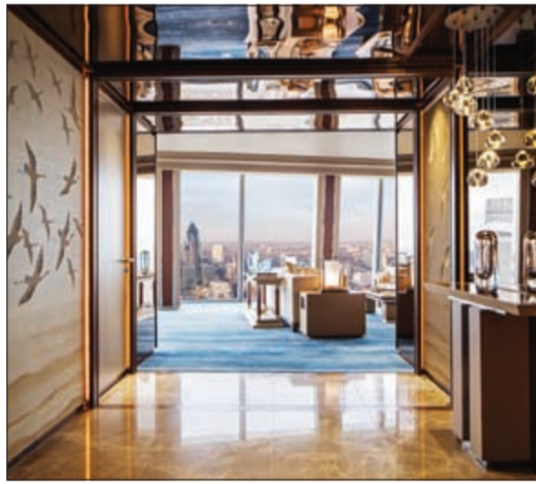
مدخل احد اجنحة الفندق في لندن