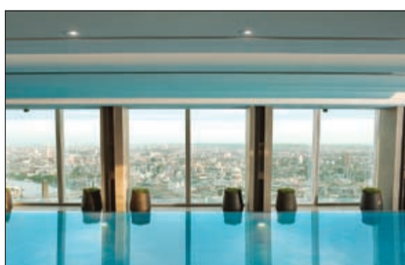
بركة السماء تطل على العاصمة البريطانية من أعلى طوابق الفندق

لندن - عاصم على أن تستحق صباحاً وأمامك واجهة كاملة من الزجاج تطل على العاصمة البريطانية ونهرها من أعلى مبنى فيها بل في الاتحاد الأوروبي، «ذا شانغريلا» وأن تتناول طعام الغفور وعلى ميمك مشهد كامل لأبرز معالم لندن. هذا هو فندق «شانغريلا - لندن» الواقع في الشطر الأعلى من مبنى «ذا شانغريلا» (95 طابقاً). ولا يمكن فهم معنى المكوث في هذا الفندق، دون معرفة قصة تصميم المبنى الذي استغرق بناؤه والتخطيط له نحو 5 سنوات (2007-2012). المهندس المعماري الشهير رينزو بيانو أراد المبنى الزجاج، امتداداً طبيعياً لنهر العاصمة (التمز)، وجزء من المساء الجارية كي يكون الميش فيه أنسيابياً كجريان النهر. تظهر هذه الفكرة أو الفلسفة في كل تفاصيل الفندق، بهوا وغرفاً، وخصوصاً بركة السباحة، حيث تختفي الزوايا وتطفو المياه، ويشعر المقيم وكأنه يسبح في كتلة صلبة من المياه، لا