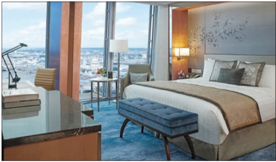
غرفة مظلة على العاصمة البريطانية