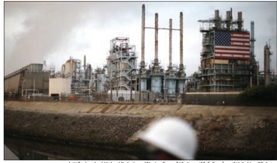
عودة 20 حفارة تنقيب أميركية كانت متوقفة عن العمل تقلس احتمالات ارتفاع أسعار النفط

وقال تقرير صادر عن بنك الكويت الوطني أن أسعار النفط أنهت شهر يونيو مسجلة سدادس ارتفاع لها على التوالي، إذ لم تتجاوز تداولات سعر مزيج برنت في الثلاثين من يونيو مستوى 50 دولاراً للبرميل، بينما تراوح سعر مزيج غرب تكساس المتوسط عند مستوى أقل من 49,8 دولاراً للبرميل. وقد أنهى مزيج برنت الشهر عند متوسط 49,5 دولاراً للبرميل و49,9 في المتوسط. ومع عودة عشرين حفارة تنقيب أميركية كانت متوقفة عن العمل فمن المحتمل أن يلوغ أسعار النفط إلى 45 إلى 50 برميل يومياً يعكس ارتفاع أسعار النفط الصخري في بعض الشركات، لذا فمن المحتمل أن تتوقف أسعار النفط عن الارتفاع تماشياً مع ارتفاع مستويات الإنتاج. ويأتي هذا الارتفاع في الأسعار بعد أن واجهت الأسواق ضغطات وذلك من جراء الاستفتاء البريطاني للخروج من الاتحاد الأوروبي في الثالث والعشرين من يونيو. وقد تراجع مزيج برنت في الأيام التي تلت نتيجة الاستفتاء بنحو 7,5% ليصل إلى أقل مستوياته منذ العاشر من شهر مايو ويستقر عند 47,16 دولاراً للبرميل. وقد تأثر النفط كبقية السلع بالتساؤلات والقلق