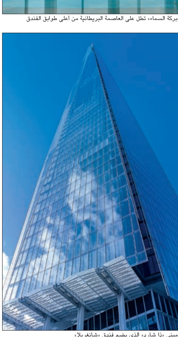
مبنى «ذا شانغريلا» الذي يضم فندق «شانغريلا»